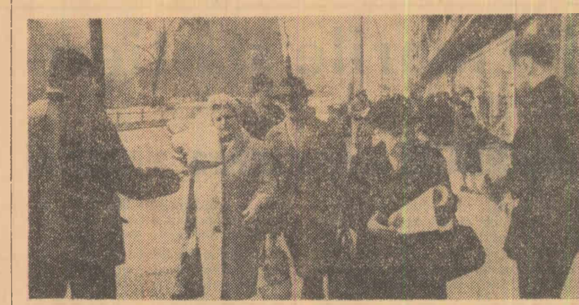
Pe o stradă din Berlinul occidental: luptători pentru pace împărșind manifeste de protest împotriva înarmării atomice