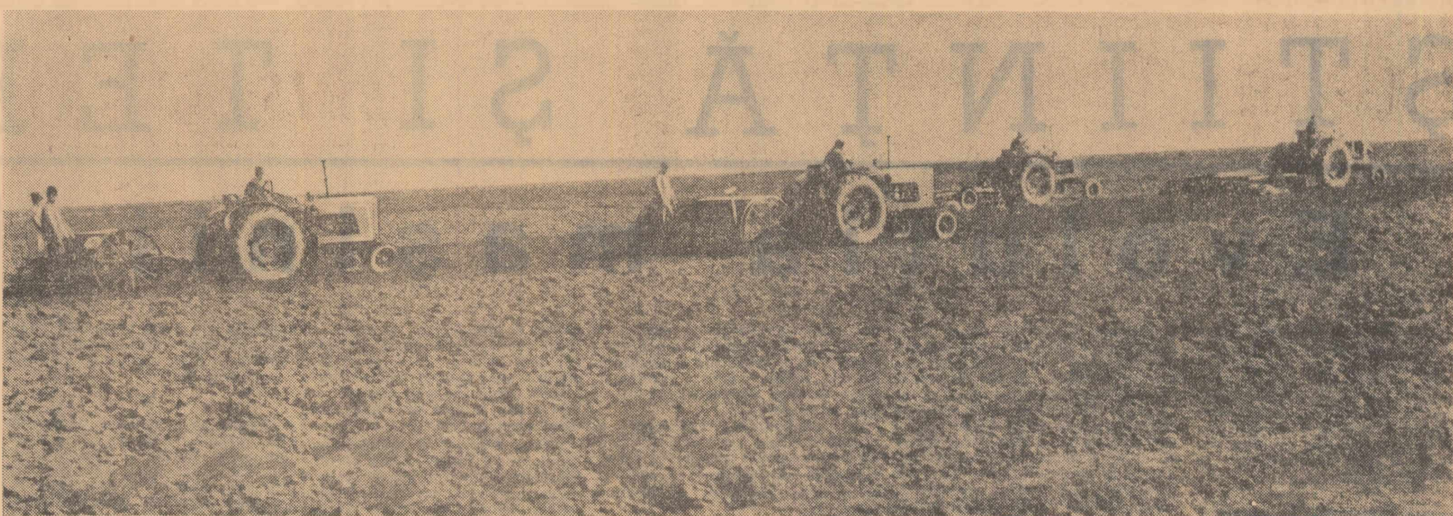
Pe ogoarele cooperativei agricole Potcoava, raionul Calărași, mecanizatorii din brigada nr. 14 de la S.M.T. Cuza Vodă lucrează de zor la semănatul mazării

În aceste zile se deslășoară din plin lucrările de primăvară. Munca în- sușește a lucrătorilor din agricultură pentru realizarea la timp a se- mănatului, pentru îngrijirea semănturilor de toamnă și a ogoarelor e- menite să pună o temelie puternică recoltei din acest an. Din cauza precipi- tațiilor abundente, precum și a temperaturii scăzute, campania agricolă a în- ceput mai târziu. Există însă condiții favorabile ca toate lucrările de primă- vară să se facă la timp și la un nivel agrotehnic înalt. Agricultură dispune de un număr sporit de tractoare, din toamnă s-au făcut arături pe suprafețe în- tînse, iar oamenii muncii de pe ogoare și specialiștii au căpătat, în cursul anilor, o experiență valoroasă. Printr-o bună organizare a muncii în gos-