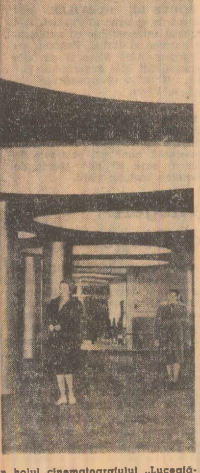
La holul cinematografului „Luceafărul” din București