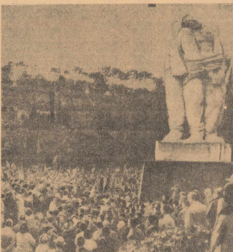
ITALIA. Zilele trecute, în prezența președintelui Republicii, Giuseppe Saragat, a avut loc o adunare în memoria luptătorilor din Mișcarea de rezistență, ucisii de fasciști în 1944

BAGDAD 29 (Agerpres). — Ziarul irakian „Al-Jumhuriya” a anunțat că Mustafa el-Barzani, liderul popu-lăriei kurde din nordul Irakului, a adresat primulului ministru, Taher Yahia, un mesaj în care sînt prezen-te 13 propuneri pentru soluțio-narea problemei kurilor. Potrivit zia-rului, propunerile sînt o reaffirma-rea binecunoscutelor poziții a kurzilor care cer autonomie în cadrul Repu-blicii Irak.