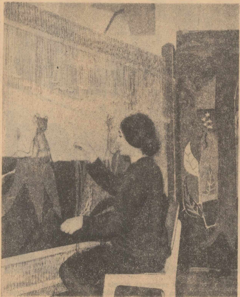
Pregătind lucrarea de diplomă (la Facultatea de arte decorative)

Zeci de mii de cetățeni se perindă zilnic prin fața celor peste 8.500 ghișee C.E.C. din țară, depun sau retrag sume pe libete. Este un drum obișnuit pentru foarte mulți. Pe an se fac milioane de asemenea drumuri. Astăzi există un libret de economii la trei locuitori, iar populația fără a ține seama are aproape 19 milioane. Poate o-ajă pus întreabarea: cum se ține socoteala banilor la C.E.C.?