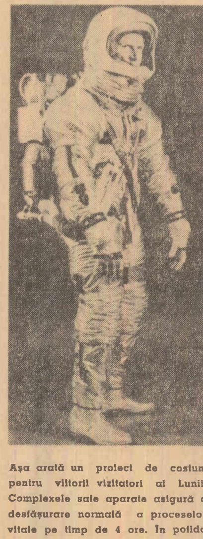
Așa arată un proiect de costum pentru vizitatorii ai Lunii. Complexele sale aparate asigură o desfășurare normală a proceselor vitale pe timp de 4 ore. În pofida armăturii de protecție împotriva radiațiilor și eventualelor meteoare, el permite o destul de mare libertate de mișcare