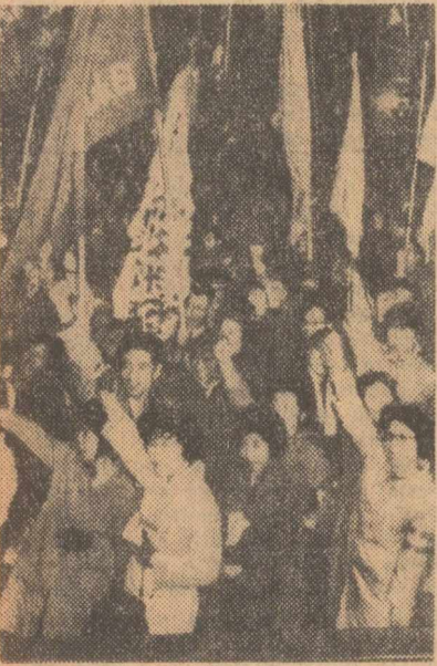
La Tokio a avut loc o demonstrație de protest împotriva folosirii de către S.U.A. a gazelor în Vietnam. Participanții au cerut încetarea acțiunilor agresive americane împotriva R. D. Vietnam

PARIS 29 (Agerpres). — Federația națională a foștilor combatanți din Franța a dat publicității un protest împotriva acțiunilor agresive ale S.U.A. în Vietnam. Federația cere încetarea imediată a acțiunilor agresive din Vietnam, acțiuni care, „în