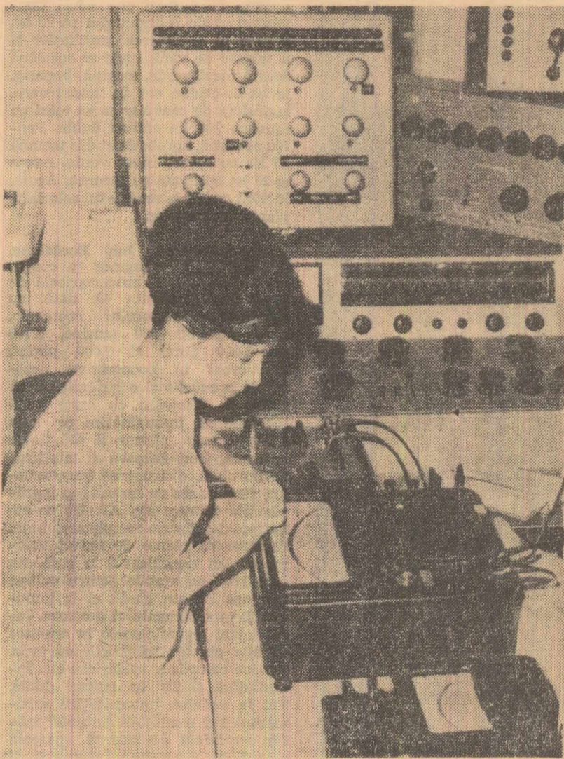
În laboratorul de curenți slabi al Centrului de metrologie nr. 1 din Capitală se face verificarea de precizie a aparatelor electrice de măsură