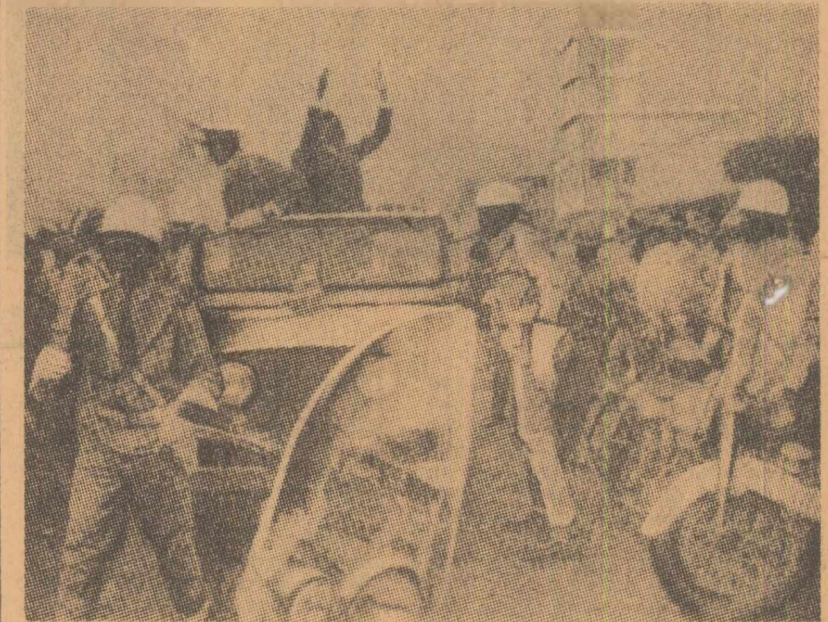
Chombe în turneul electoral, înconjurat de o gardă numeroasă

CAIRO 1 (Agerpres). — Primul ministru al guvernului revoluționar congolez, Christophe Ghenye, a părăsit capitala R.A.U., unde a conferit cu președintele Nasser și cu alte