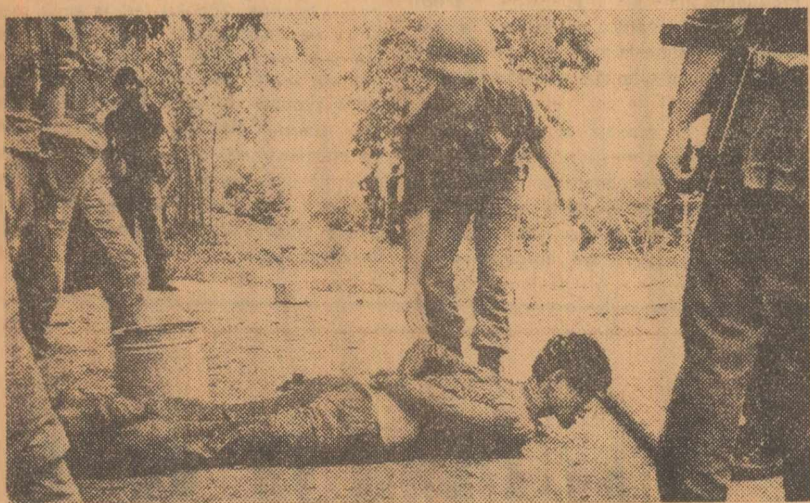
Imagine din Vietnamul de sud: operațiile de război ale S.U.A. împotriva R. D. Vietnam, folosirea gazelor toxice sînt însoțite de intensificarea represaliilor trupelor americane împotriva populației sud-vietnameze

După cum anunță buletinul de știri al Casei Albe, ambasadorul american la Saigon, Maxwell Taylor, a declarat la Washington în fața ziaristilor: „Vom continua programul trasat de președinte, independent de acțiunile pe care le întreprinde Vietcongul”. Exprimîndu-și regretul pentru pierderile în urma exploziei de la ambasada americană de la Saigon, el a adăugat: „Este unul din riscurile activității noastre de acolo”.