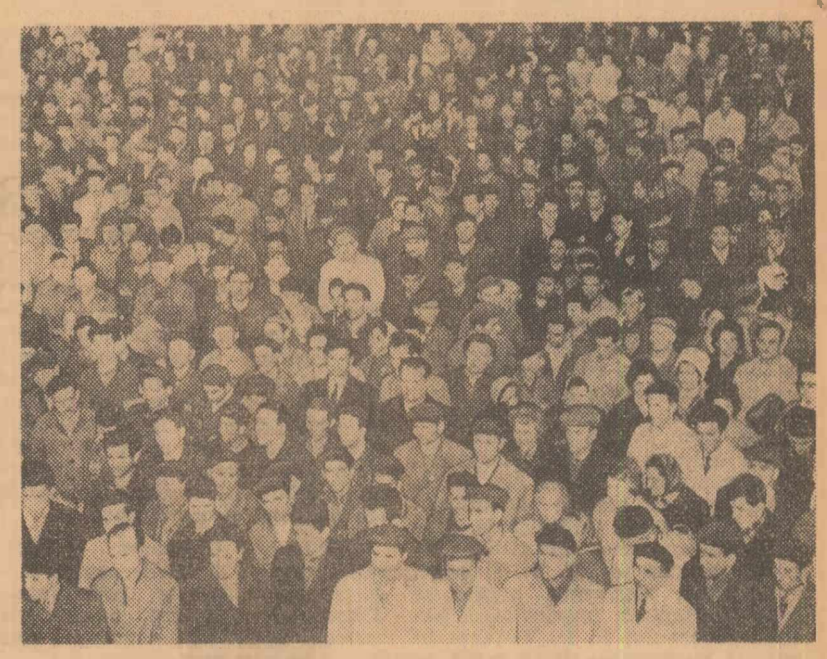
În timpul mitingului de la Uzinele „Grivița roșie”

În încheierea mitingurilor au fost aprobate moțiuni în care este condamnată agresiunea americană în Vietnam și se reafirmă solidaritatea frățească a poporului nostru cu lupta poporului vietnamez. (Agerpres)