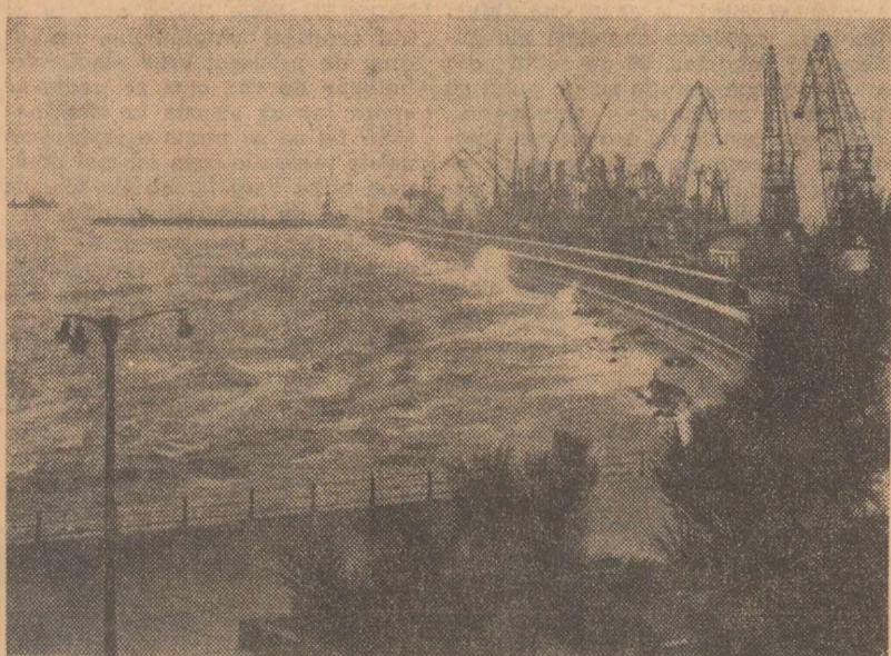
„Arcul” de piatră și beton al portului Constanța

KWAME NKURUMAH Președintele Republicii Ghana