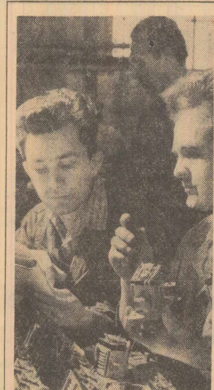
Întreprinderea „Electrotehnica” din Capitală. Se lucrează la un nou lot de relee de 350 A.