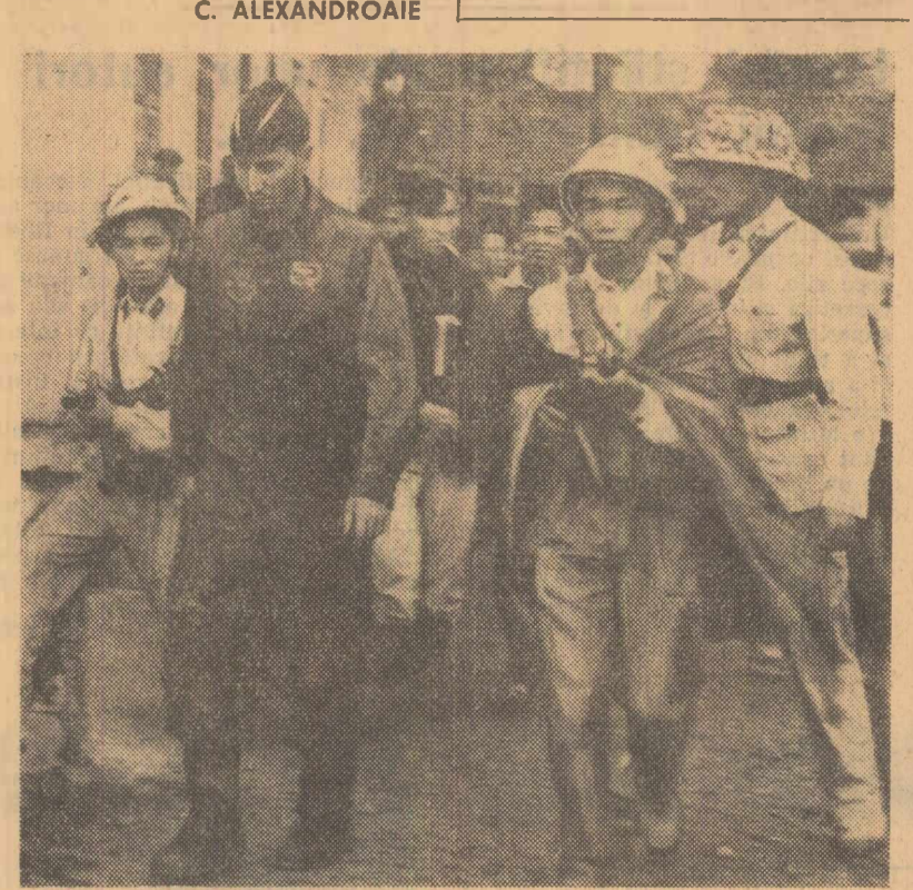
Ripostind atacurilor criminale ale aviației americane, eroicii apărători ai cerului R. D. Vietnam doborât și avariază tot mai multe avioane agresoare. În fotografie — unul dintre piloții unui avion american doborît deasupra teritoriului nord-vietnamez

din portul Kobe. Comandamentul forțelor maritime militare ale S.U.A. din Japonia a propus celor două sindicate ca 380 de marinari japonezi să facă parte din echipajele navelor care transportă materiale militare la Saigon. Propunerea a fost respinsă.