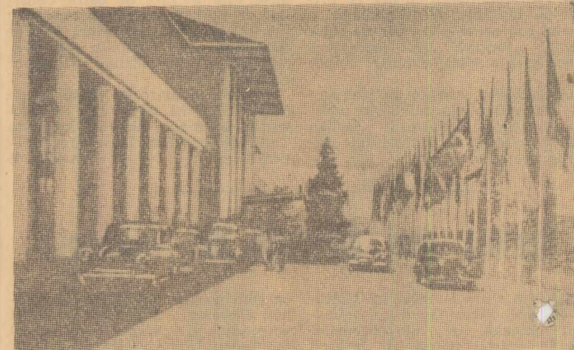
Bandung. Clădirea în care s-a ținut conferința

Astăzi se împlinesc zece ani de la prima conferință a statelor independente din Asia și Africa.