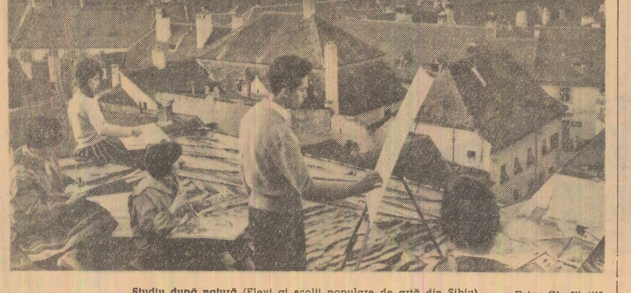
Studiu după natură (Elevi ai școlii populare de artă din Sibiu)

În zilele de 16 și 17 aprilie a avut loc în Capitală cea de-a IX-a sesiune științifică a cadrelor didactice din Institutul de petrol, gaze și geologie. Au luat parte reprezentanți ai Ministerului Învățămîntului, Ministerului Industriilor Petrolului și Chimiei, institutelor de cercetări din acest domeniu, cadre didactice. Pe agenda sesiunii sînt figurat 77 de comunicări științifice privind probleme de geologie și geofizică, exploatarea zăcămintelor de petrol, tehnologia și chimizarea țiteiului și gazelor, modernizarea utilajului petrolier, pregătirea tinerilor cercetători.