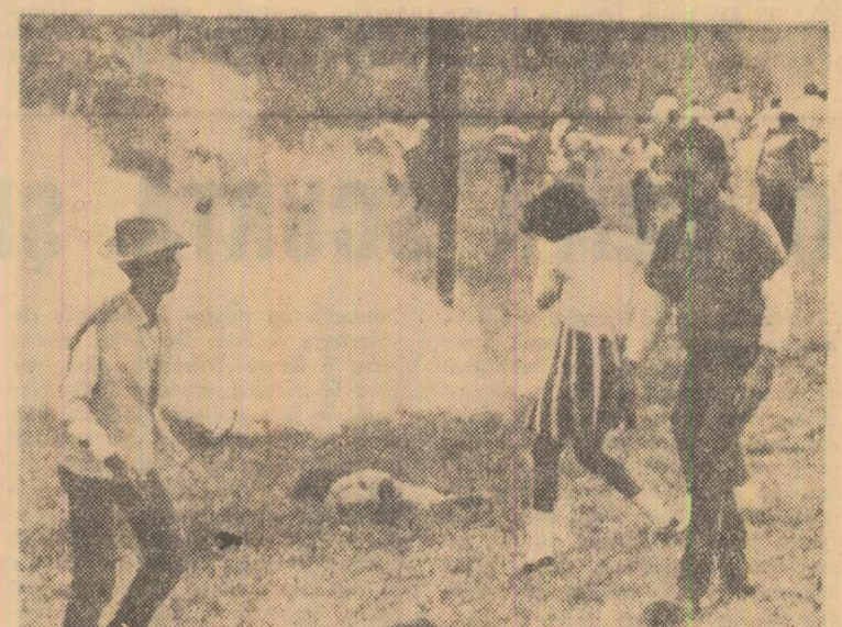
Politia din orașul Camden (statul Alabama) atacă cu grenade fumigene pe participanții la o demonstrație în apărarea drepturilor cetățenești ale populației de culoare

Acum, totuși, la 100 de ani după moartea lui Lincoln, constatăm că cele mai multe dintre imperiile europene din Africa au fost destrămate, cu excepția celui portughez și a anomaliilor de la Pretoria, de la capătul sudic al continentului negru. (Autorul are în vedere existența statului rasistilor albi — Republica Sud-africană — n.r.). În schimb, pe negrii americani îi găsim perseverenți în lupta lor grea pentru drepturile ce le-au fost de mult promise.