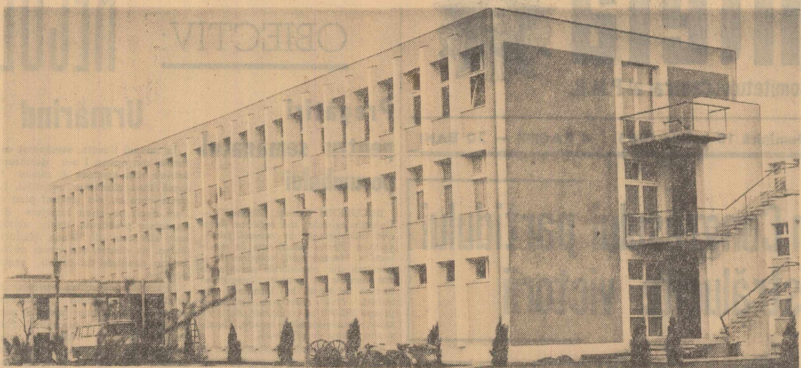
În cursul zilei de ieri, în Capitală a fost dată în folosință o nouă și modernă policlinică (în fotografia de mai sus) în raionul 23 August, care va deservi salariații Uzinelor „23 August”, „Republika”, ai Fabricii de mașini-unelte și greutăți București și ai Institutului de proiectări mașini-unelte. Așezată în mijlocul unui parc pe strada Tineretului, construcția, cu parter și două etaje, impresionează prin stilul său arhitectonic simplu și elegant. În cele aproape 200 de încăperi funcționează opt circumscripții de uzină în cadrul a medicilor de 16 specialități diferite (interne, chirurgie, O.R.L., oftalmologie, stomatologie, dermatologie, fiziologie etc.). Asistența de urgență la locul de muncă în uzinele așezate este asigurată de 10 posturi sanitare de prim-ajutor. Noua unitate mai are servicii de balneoterapie și electroterapie, de micro-radio-

La Fabrica de postav „Proletarul” din Bacău lucrează un mare număr de femei. Primirea în rîndurile partidului a celor mai bune muncitoare și tehniciene constituie o preocupare permanentă a organizațiilor de bază din secțiile întreprinderii. În ultima vreme au fost primite în rîndurile membrilor și candidaților de partid 15 femei, majoritatea din rîndul teșitoarelor și filatoarelor frunțase, muncitoare harnice în producție ca și în activitatea obstească. Pentru educarea noilor membri și candidați de partid, comitetul de partid din fabrică organizează cu regularitate conferințe, vizite la muze, vizionări de filme documentare și alte acțiuni.