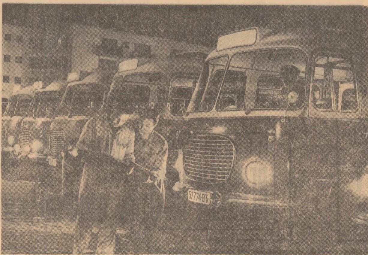
Înainte plecării în cursă

Pentru fixarea albiei regularizate a râului s-au făcut diferite lucrări: pînă, diguri de dirijare submersibile, închideri de albie, apărări de mal etc. S-au folosit cu această ocazie mari cantități de blocuri de beton. Pentru a reduce volumul excavărilor s-a căutat ca albia regularizată să urmărească traseul diferitelor brațe existente ale râului. Acolo unde a fost necesar să se creeze o albie nouă, s-a utilizat metoda canalului de străpungere de lățime mică, urmînd ca apoi albia să se lărgască datorită capacității de eroziune și de transport a râului. O bună parte a lucrărilor de regularizare executate pe râul Siret au și făcut față la numeroase viituri.