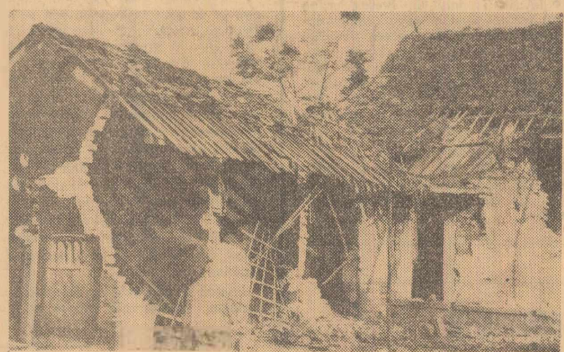
În urma raidurilor aviației americane asupra teritoriului R. D. Vietnam.

„Desigur, a declarat președintele de Gaulle, această independență pe care o practicăm din nou în toate domeniile nu a întîrziat să impresioneze, de fapt să scandalizeze, diverse cercuri pentru care înfăptuirea Franței era o obișnuință și o regulă... Pe de altă parte, faptul că noi ne-am recăpatat facultatea de a judeca și de a acționa față de toate problemele pare să supere un stat care putea să se creadă, în virtutea puterii sale, investit cu o responsabilitate supremă și universală”. Dar, a încheiat președintele, „pentru noi, pentru toți, mai mult ca oricînd este necesar ca Franța să fie Franța”.