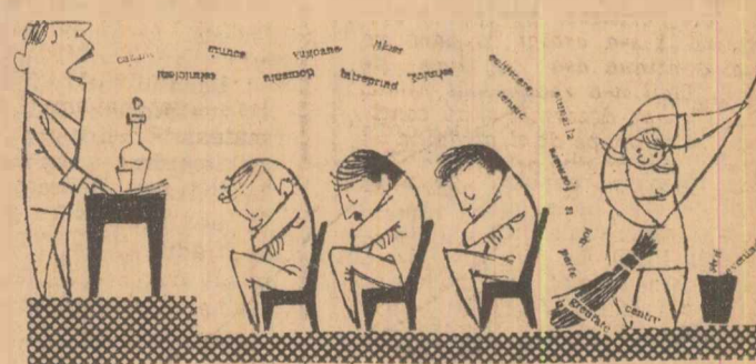
Cînd conferința e pur formală...

să-l constituie rezultatele obținute în producție.