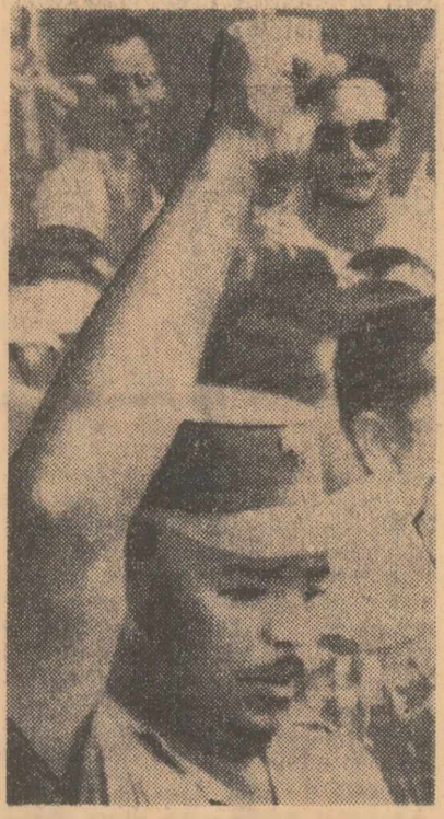
Noul președinte provizoriu al Republicii Dominicană, colonelul Francisco Caamaño, răspunzând ocaziilor mulțimii după depunerea jurământului

SANTIAGO DE CHILE. La fost organ-pitala Republicii Chile a fost organiza-