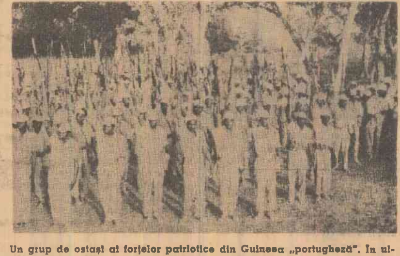
Un grup de ostași ai forțelor patriotice din Guinea „portugheză”. În ultimul timp acestea au obținut succese importante în lupta împotriva trupelor colonialiste portugheze

SAIGON 5 (Agerpres). — În dimineața zilei de 5 mai au debarcat în Vietnamul de sud 1.200 de soldați și ofițeri aparținînd brigăzii 173 de parașutiști americani staționată în Okinawa. Această brigadă, care numără 3.500 de oameni, urmează să se adauge celorlalte forte ale S.U.A. din Vietnamul de sud, a anunțat agenția Associated Press.