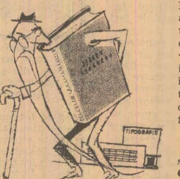
...Și ce chipez flacău eram... ca manuscris.

Unel cărți tehnice se perimează printr-un prea îndelung proces editorial și tipografic