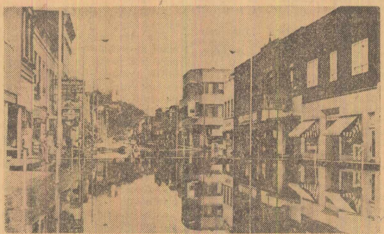
Orașul Hannibal (statul Missouri — S.U.A.) a fost înundat în urma revărsării fluviului Mississippi

Dezbaterile s-au prîlungit pînă aproape de miezul nopții. Pusă la vot, Cartea Albă cu privire la naționalizarea industriei oțelului a fost adoptată cu 310 voturi pentru și 306 contra. Deputații partidelor conservatoare și liberal au votat împotriva proiectului de lege.