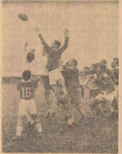
Reprezentativele de rugbi seniori și juniori ale Bucureștilui aliate în pregătire pentru apropiata întâlnire cu selecționata similară aie Pirinelor, au susținut ieri un joc de antrenament pe stadionul Gloria din Capitală.

cord republican egalat). La armă liberă calibrul redus 3x40, pe primul loc s-a clasat N. Rotaru (Steaua) cu 1135 puncte. Întrecerile continuă astăzi.