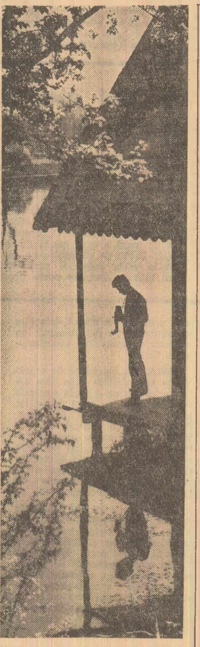
La Muzeul Satului