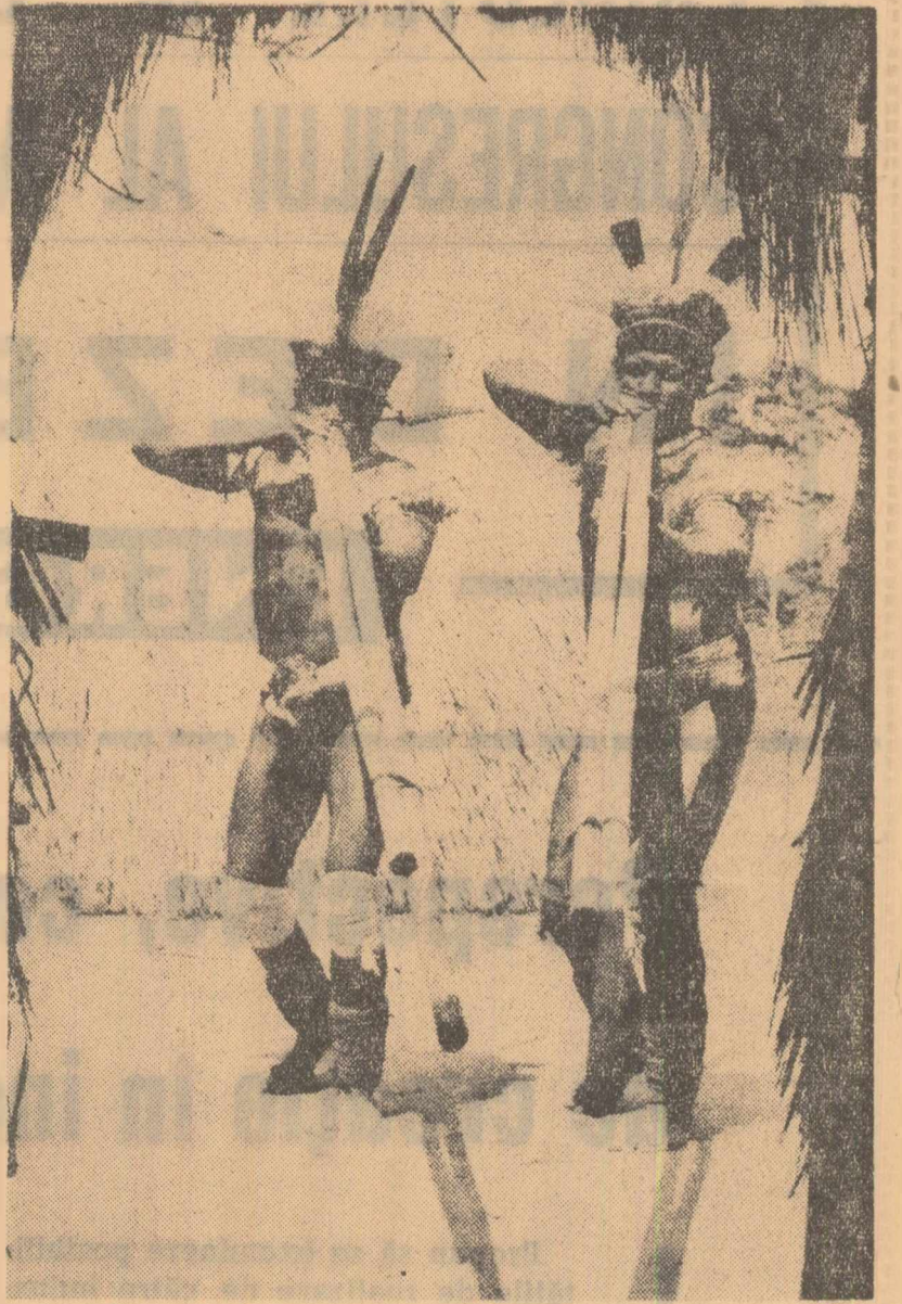
Răsună tobele și flauturile „urud”