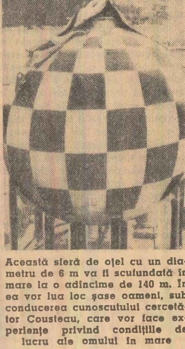
Această sterd de oțel cu un diametru de 6 m va fi scuturată în mare la o adîncime de 140 m. În ea vor lua loc șase oameni, sub conducerea cunoscutului cercetător Cousteau, care vor face experiențe privind condițiile de lucru ale omului în mare

De fapt examinarea problemei a început încă în urmă cu opt luni, cu prilejul unui week-end asemănător organizat tot la Chequers, în noiembrie, anul trecut. De atunci guvernul laborist a abandonat trei mari proiecte de construcții de avioane militare. Astfel, au fost oprite lucrările la construirea bombardierului tactic și de reconaștere „SR-2”, la avionul de vînătoare cu reacție „P-154” și la avionul de transport „HS-681” o parte a comenzilor de avioane fiind îndreptate spre industria aeronautică nord-americană. De data aceasta, surse informale au declarat, după cum arată agenția Reuter, că „principalele direcții a economiilor va fi axată spre cheltuielile militare efectuate în străinătate”. Primul ministru Wilson declarase deja că guvernul său este hotărât să reducă cu 50 până la 100 milioane de lire aceste cheltuieli care s-au ridicat anul trecut la 300 milioane de lire. De pe acum a început să se vorbească despre eventuale desființări a unor baze militare din străinătate, a căror menținere nu mai are de fapt o însemnătate strategică în actualul stadiu de dezvoltare a tehnicii de luptă.