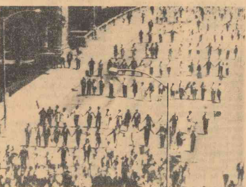
La Chicago continuă acțiunile populației de culoare în sprijinul luptei pentru înlăturarea discriminărilor rasiale în școli. În fotografie: aspect din timpul unei demonstrații care a avut loc zilele trecute pe străzile orașului

Participanții la miting și-au exprimat hotărîrea de a lupta pentru reînnoirea regimului constituțional și au cerut evacuarea trupelor străine din țară. Pe de altă parte, între reprezentanții O.S.A. și reprezentanții celor două părți aflate în conflict au continuat tratativele. Concilierea reprezentanților O.S.A. nu a dus nici pînă în prezent la rezolvarea crizei politice, cele două părți rămînd pe pozițiile cunoscute. Caamano condiționează soluționarea crizei de revenirea la regimul constituțional. În timp ce generalul Barreras pretinde că deține controlul în țară și deci guvernul său ar fi singurul legal.