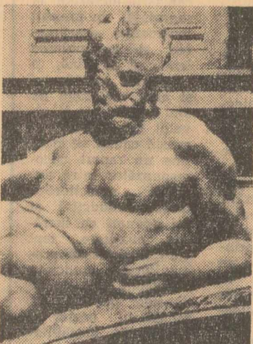
Capela Medicilor. Amurgul (fragment)