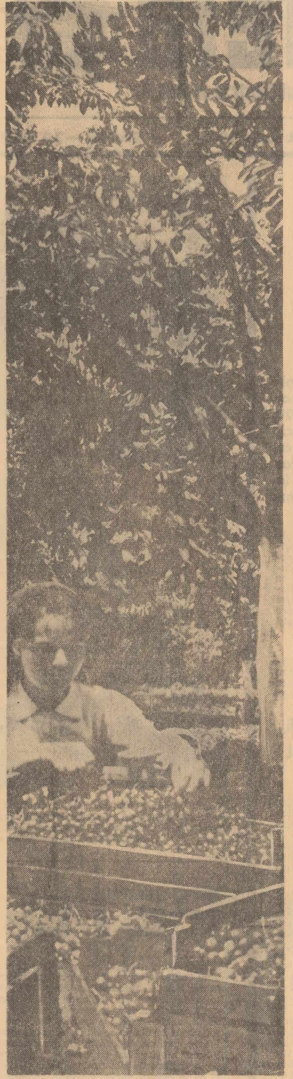
Recoltatul cireselor la G.A.S. Popești-Leordeni