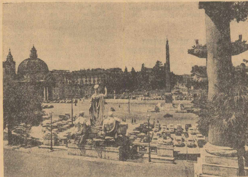
Vedere din Roma

Prin vânzările sale, Statele Unite au devenit cel mai mare negustor de arme din lume. Din motive economice ele concurează în acest domeniu Marea Britanie și Franța. Ofensiva vânzării de arme în Europa occidentală, incluzând credite garantate de Pentagon, a provocat o considerabilă îngrijorare la Paris și la Londra unde, de curând, în unele ziare au apărut aspre critici.