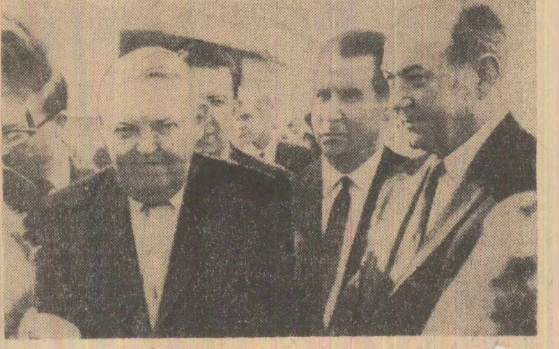
La 4 iunie, cancelarul vest-german L. Erhard, însoțit de ministrul de externe, G. Schröder, a avut convorbiri în Washington cu oficialități americane. În fotografie: la întrevădere cu D. Rusk, secretarul Departamentului de Stat.

CARACAS. Detinutii politici venezueleni, aflați în închisoarea Districtului central, au declarat greva foamei în semn de protest împotriva tratamentului la care sînt supuși. Acțiunea lor este sprijinită de Centrala unitară a oamenilor muncii, care a chemat populația țării să acționeze în apărarea patrioților și să obțină punerea în libertate a fruntașilor politici detinuți. Mai multe partide și organizații au dat publicității declarații exprimînd recunoștința patrioților venezueleni pentru campania desfășurată în multe țări ale lumii în favoarea eliberării lor.