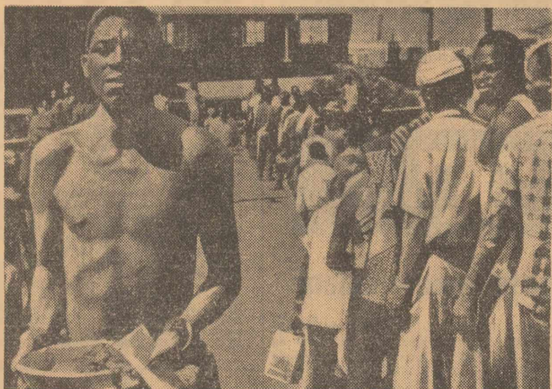
Un spectacol deosebit. Intr-un lagăr pentru muncitorii negri din Republica Sud-Africană se distribuie rația de mâncare

Problema Rhodesiei de sud va constitui, de asemenea, obiectul unor discuții aprinse, deoarece o serie de țări africane vor reproșa Marii Britanii afloatarea prea îndăgătoare pentru planurile lui Ian Smith.