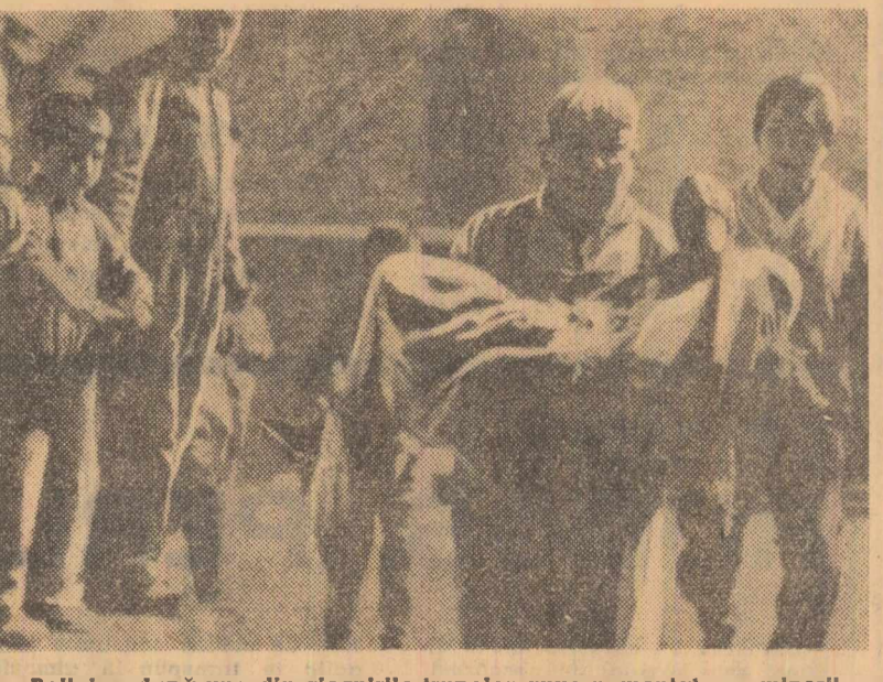
Bolivia : după una din ciocnirile trupelor guvernamentale cu minerii