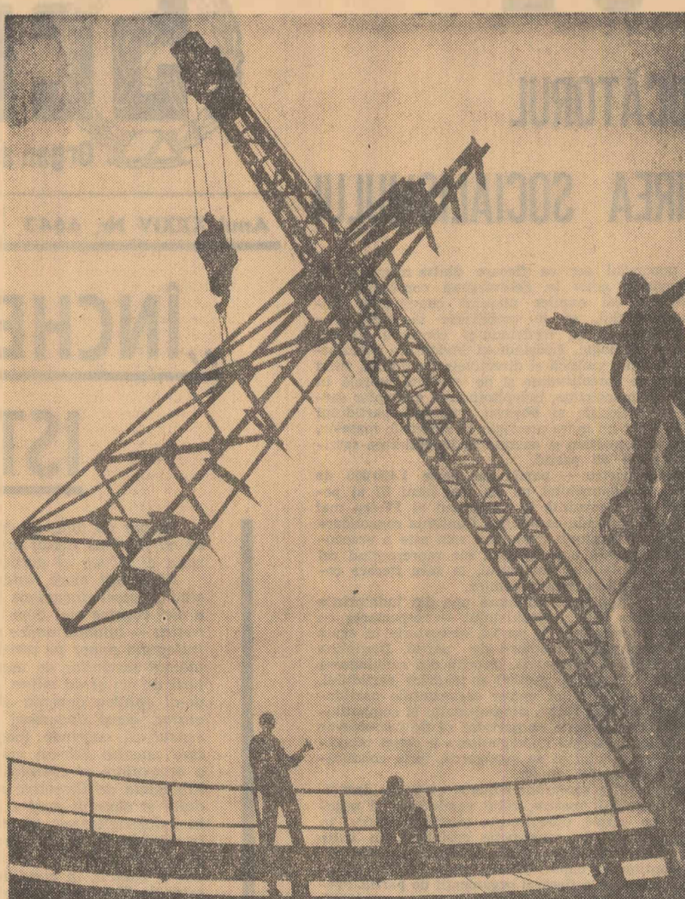
Modernizare. La Uzina metalurgică din Coșca Mică se montează rațele unei instalații de separare a minereurilor