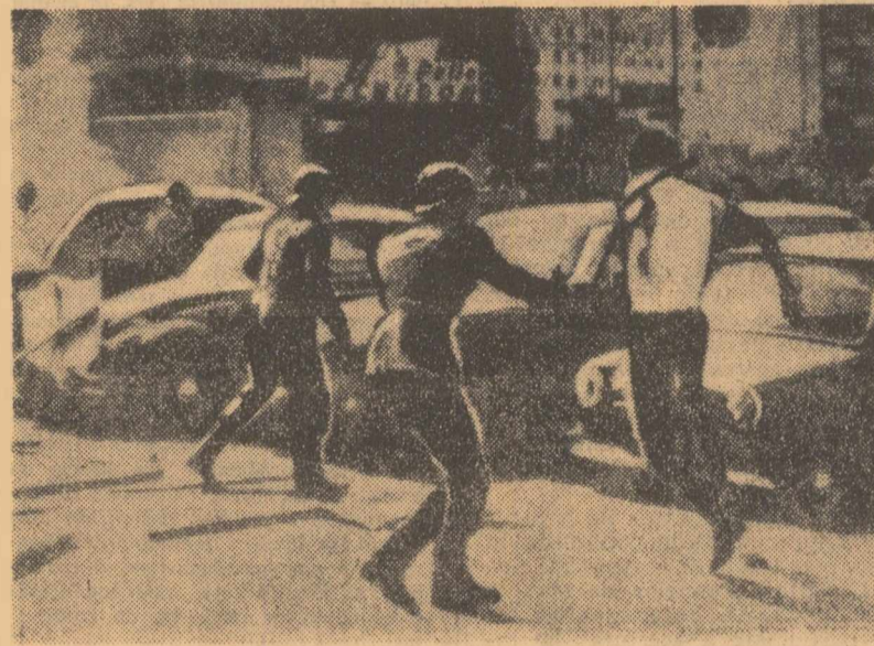
Politiștii din Lima (Peru) lovind cu bastoane de cauciuc pe participanții la o demonstrație împotriva intervenției S.U.A. în Republica Dominicană

recuperării, McDivitt a declarat că ațit el cât și White se simt bine. Zborul navei cosmice americane „Gemini-4” a durat, din momentul lansării și pînă la amerizare, 97,57 ore. După cum s-a mai anunțat, în prima zi de zbor cosmonautul Edward White a ieșit din cabină și a evoluat timp de aproximativ 20 de minute în spațiul cosmic. Încercarea de atingere de către White a celei de-a doua trepte a rachetei purtătoare în timpul evoluției sale în spațiu a fost abandonată. O mare cantitate de carburanți a fost consumată în timpul manevrelor de apropiere a navei de cea de-a doua treaptă a rachetei. Aceasta a determinat N.A.S.A. să anuleze tentativa de „întâlnire spațială” între „Gemini-4” și treapta a doua a rachetei purtătoare. Ulterior s-a anunțat că unul din obiectivele principale ale zborului celor doi cosmonauți americani este de a se stabili ciclurile regulate de muncă, somn și repaus pentru zborurile de lungă durată și de a furniza date asupra felului în care astronautii se comportă în stare de imponderabilitate pe o perioadă lungă de timp.