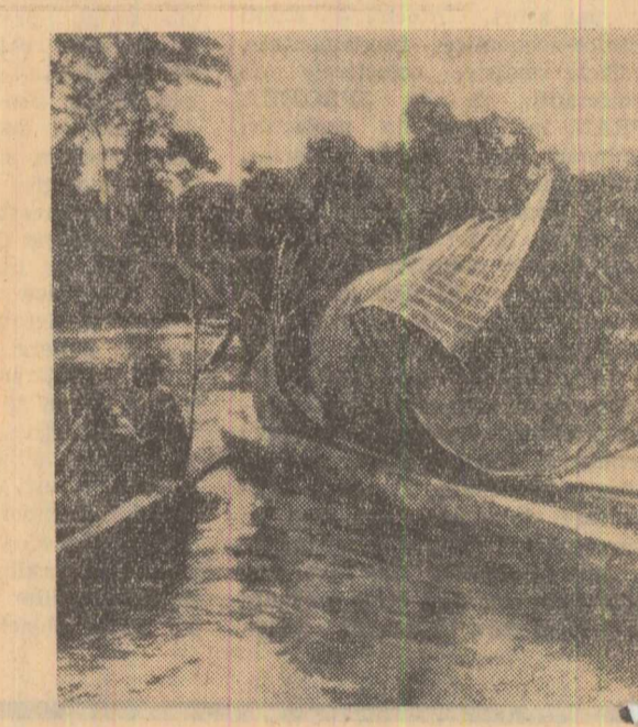
În zori la pescuit pe fluviul Congo

În limba locurilor înseamnă „apa cea mare”. De la izvoarele alinate unde în regiunea lacurilor rhodensiene pînă la vărsarea în Oceanul Atlantic fluviul Congo măsoară 4650 de km. Cine îl urmărește drumul pe hartă se gîndește la un imens arc de triumf. Unul din picajele arcului e înfipt adînc în junglă. Celălalt picior atinge oceanul. Fluviul are două nume — înainte de a se numi Congo, o bună parte a sa se numește Laubala; traversează de două ori Ecuatorul — o dată la Ponterville și o dată la Coquilhatville; desparte două mari orașe — Brazzaville și Leopoldville; dă numele lui celor două state congoleze care se întind în centrul continentului african.