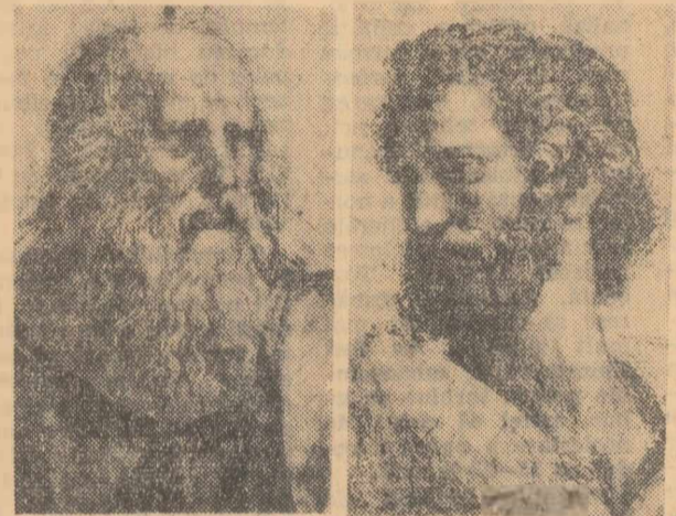
ȘCOALA DIN ATENA (fragmente) Portretele lui Platon și Aristotel

Pe această uriașă perspectivă arhitecturală, pe treptele acestei arhitecturi, Rafael s-a figurat pe reprezentanții gândirii grecești; e un breviar de filozofie, tradus în diversitatea unor frumoase și elocvente alititudini. În centru, Platon, bătrînel cu barbă venerabilă, înalță degetul spre cer, metaforă menită să traducă sensul idealist al cunoașterii sale. Aristotel, dimpotrivă, întinde mîna spre pămînt, simbol al gândirii sale realiste. În jurul lor, două grupe de discipoli: fresca, de un admirabil echilibru, are o tensiune dialectică. La stînga lui Platon, Socrate, cin, gestivulează; Diogene, cinic, stă trîntit jos pe o treaptă, cum se cuvenea, făcînd trecerea de la planul al II-lea la planul I al compoziției. Este aici nu numai Heraclit,