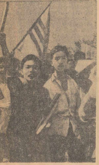
Pe străzile Saigonului, tinerii demonstrează împotriva regimului sud-vietnamez

BUENOS AIRES 8 (Agerpres). — Consulul general al Statelor Unite în Argentina a fost rănit luni seara de către un grup de persoane necunoscute care au tras din goana mașinii asupra lui, în timp ce se înalpa acasă în propriul său automobil. Consulul american a fost transportat urgent la spital. Agențiile occidentale anunță că starea sănătății lui este foarte gravă.