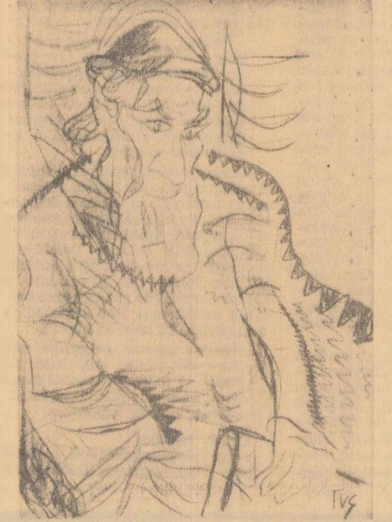
ION TUCULESCU Schiță pentru portretul lui Gala Galaction