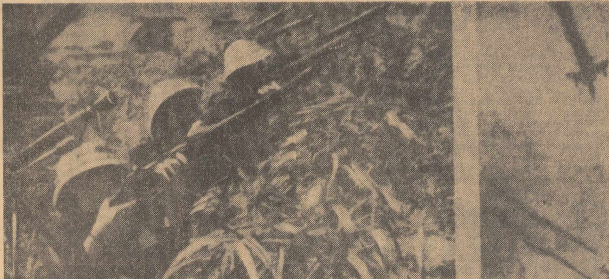
De veghe împotriva agresorilor. Avionul dușman a fost aținat. La 29 lună a fost doborât al 357-lea avion avînd însemnele S.U.A.

În încheiere, vorbitorul a subliniat necesitatea unității mișcării muncitorești și a forțelor progresiste internaționale în lupta împotriva imperialismului, pentru apărarea pacii.