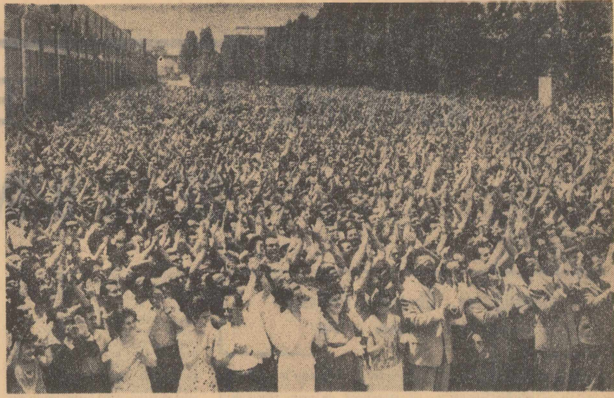
La adunarea de la uzinele „1 Mai”-Ploiești