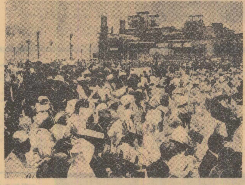
În localitatea Safi (Maroc) a fost inaugurat un mare complex modern al industriei chimice. Mii de cetățeni au fost prezenți la solemnitatea inaugurării