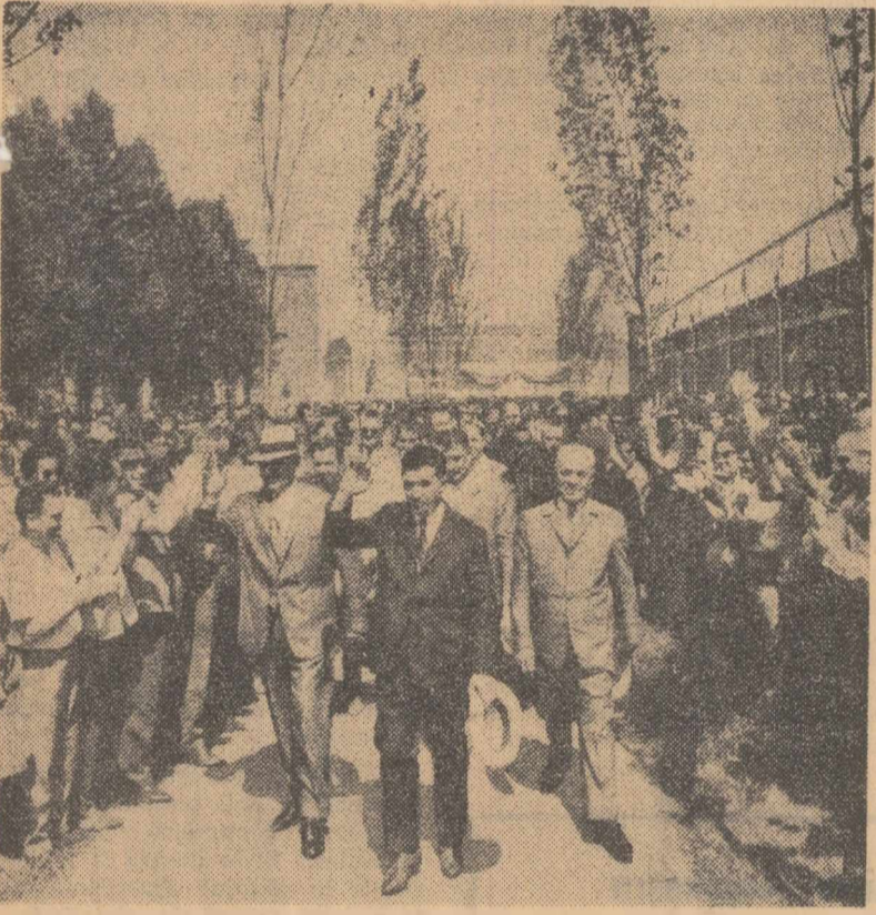
Oamenii muncii participanți la adunarea de la uzinele „1 Mai” salută cu căldură pe conducătorii de partid și de stat

În ziua de 2 iulie tovarășii Nicolae Ceaușescu, prim-secretar al C.C. al P.M.R., Ion Gheorghe Maurer, membru al Biroului Politic al C.C. al P.M.R., vicepreședintele Consiliului de Miniștri al R.P. Române, Emil Bodnaraș, membru al Biroului Politic al C.C. al P.M.R., vicepreședintele al Consiliului de Miniștri, au venit în mijlocul oamenilor muncii din orașul Ploiești.