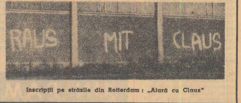
Inscripții pe străzile din Rotterdam: „Afară cu Claus”

Zilele trecute, regi-a fost cîndva ofițer al na mamă a Olandei a Wehrmacht-ului. În Olanda, casa-toria moștenitorului la diplomatul vest-german Claus von Amsterg, aprobată de parlament prin lege. Alții a logodnei, care era doborât un zvon, a stîrniți succese. Va renunța o reacție neașteptată. Beatrice la iron de diplomat vest-german. Pe străzile din Amsterdam dragul lui Claus? A Se caută deci certitudinea a apărut scris: fost sau nu acesta un zvon pentru Claus. Decamdata, ieri agențiile de ignoră că von Amsterg un olandez a trimis presa transmise foto-berg, astăzi diplomat în Italia. Într-o misi-grafiile tinerilor care în Germania federală, une „specială secretă sint în vizită în R.F.G.