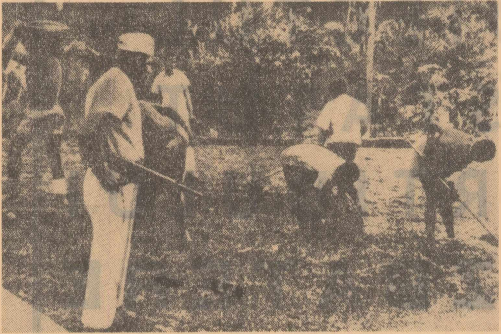
Muncitorii agricoli angolezi lucrează sub pază armată

Desi guvernul și la Lisabona o proclamă ca Angola, Mozambicul și celelalte teritorii aflate sub administrația sa nu ar fi posesiuni coloniale, ci „provincii” portugheze, discriminarea între metropola și acestea este consfințită nu numai prin declarații ca aceea pe care am citat-o, ci și prin Codul muncii. Chiar în