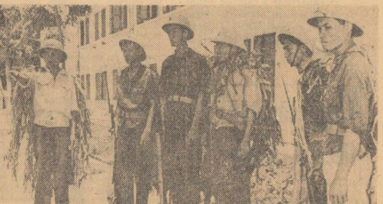
R. D. Vietnam. Muncitorii de la o uzină constructoare de mașini din Hanoi în timpul instrucției de autoapărare

HANOI 3 (Agerpres). — Aviația americană a lansat din nou gaze toxice asupra unor localități din provincia sud-vietnameză Tra Vinh, relatează agenția V.N.A. Un număr de 30.000 de locuitori, adică două treimi din populația acestor localități, au avut de suferit, iar numeroase animale domestice au fost intoxicate.