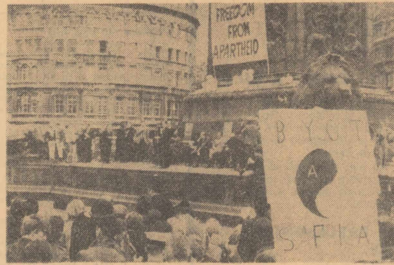
Miting antiapartheid în piața Trafalgar din Londra