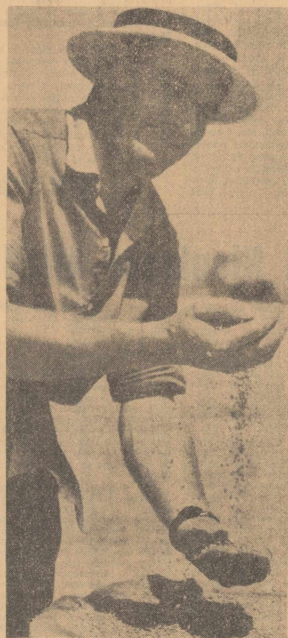
Recolta nouă