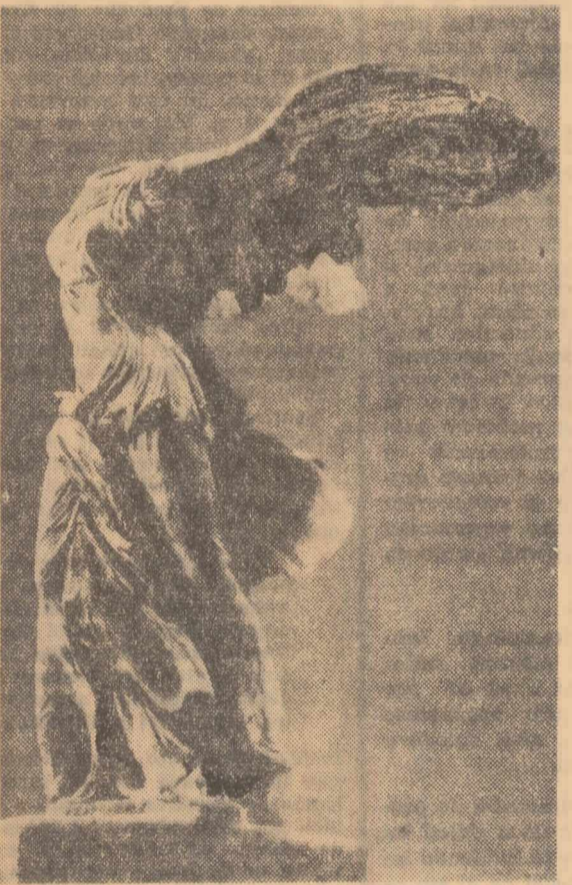
Victoria din Samotracia

me, rezistente la eforturi fizice, și purtînd un vestiment, pe care puterea vîntului îl lipsește complet în fața de trupul admirabil de armonios construit, pe cînd la spate îl agită în chip vehement. Și ei îi lipsesc părți esențiale din trup: capul, mințile și partea de jos a picioarelor. Ce este de necrezut, este că aceste lipsuri aproape nu se observă, nu ne gîndim la ele cînd privim făptura desăvîrșită a Victoriei, fiindcă elanul mișcării este atât de puternic exprimat, încît fără voie o vedem zburînd și ne vin în minte acele scene de păsări călătoare, la care nu mai distingem detaliile, ci numai forma lor elegantă și atât de proeminentă și plină de viață, care se proiectează pe cer. Minuena pe care a realizat-o autorul acestei statui este tocmai că ne-a dat impresia de a o vedea în momentul în care își taie elanul, dar totuși în așa fel prezentată, încît par-