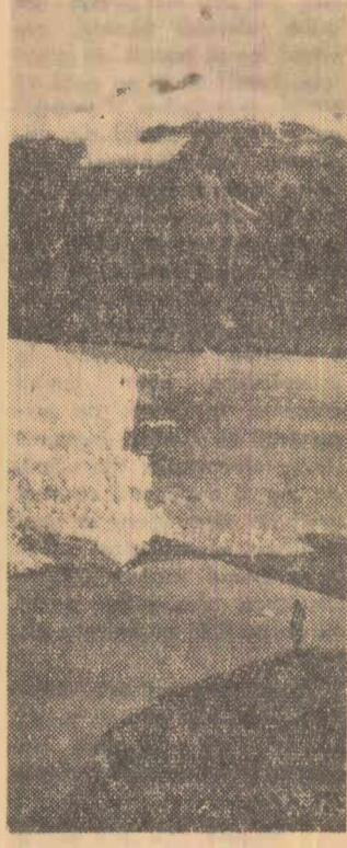
Partea frontală a ghetarului Blomstrand din Spitzbergen s-a prăbușit în mare de la 40 de metri înălțime. A luat naștere încă un aisberg!

Ghetarii și aisbergurile Priveliști en-plesitoare, de neuitat. Pînă și pe subrolul de silință ale lui transformă într-un poet. Cînd le zăreste pentru prima oară, în 1897, cu prilejul expediției sale în Antarctica, Emil Racoviță notează: „Munți uriași înalți în aer piscurii învalute în troiene scilpitoare, iar în poale poartă ghetari mărești, ce umplu văile cu masele lor străvechi și pătrund în mare cu lunți prăpăstioase, brazdate de albastru... În mijlocul mării, inel și măreț, plutesc munți de gheață, albi în soare și albaștri în umbră”.