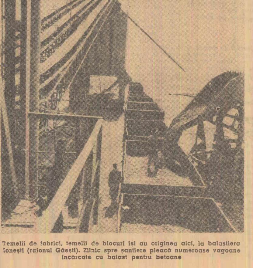
Temelii de fabrică, temelii de blocuri și a originii aici, la balastiera Ionești (raionul Găești). Zilnic spre șantiere pleacă numeroase vagoane încărcate cu balast pentru betoane

Am solicitat să răspundă la această întrebare pe tov. NICOLAE IONESCU, vicepreședinte al Consiliului Superior al Agriculturii. (Textul articolului Miriștea în pag. a II-a).