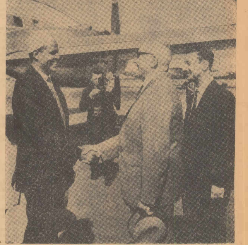
La sosit pe aeroport

La invitația președintelui Consiliului de Miniștri al R. P. Române, Ion Gheorghe Maurer, marți după-amiază a sosit la București primul ministru al Republicii Somalia, Abdirazak Haji Hussein, care va face o vizită oficială în Republica Populară Română.