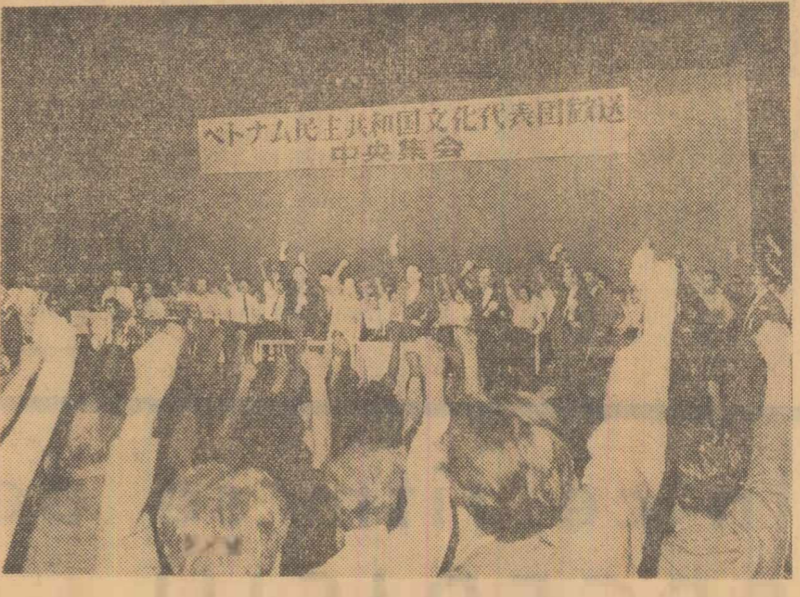
TOKIO. Miting de solidaritate cu lupta poporului vietnamez împotriva agresiunii americane

SANAA 8 (Agerpres). — Știrile sosite în ultimele 24 de ore din Sanaa și Cairo indică agravarea crizei politice din Yemen. Miercuri seara, președintele Sallal a participat la o nouă reuniune a Consiliului suprem al forțelor armate, organism creat cu două săptămîni în urmă cu scopul de „a mări potențialul de apărare al țării împotriva pericolului extern”. Deși agențiile de presă au transmis știrea constituirii unui nou guvern yemenit, al cărui șef a devenit însuși președintele Sallal, pînă acum nu există o confirmare oficială că acest guvern a și fost constituit. În dezacord cu președintele Sallal se găsește acum și un alt lider yemenit, Abdul Iryani, membru al Consiliului prezidențial. Abdul Iryani a făcut o declarație correspondentului agenției Reuter la Cairo arînd că „formarea Consiliului suprem al forțelor armate de către președintele Sallal reprezintă un act neconstituțional”.