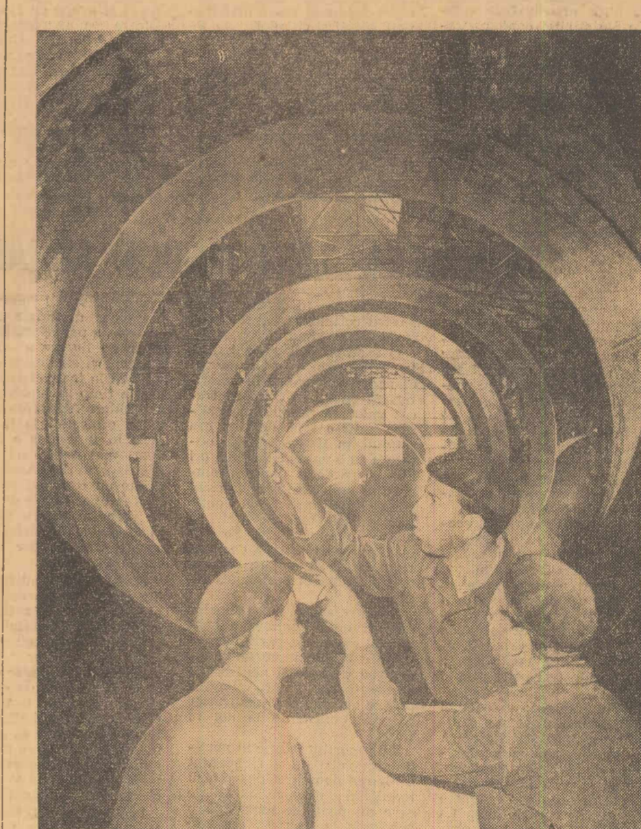
In secția cazangerie a uzinelor „Grivița Roșie” din Capitală. Colectivul secției obține în aceste zile noi succese în întrecerea socialistă. Între 10 și 20 litru au fost realizate peste plan patru agregate pentru industria chimică

ÎN EDITURA POLITICĂ a apărut: GHEORGHE APOSTOL Raport cu privire la proiectul Statutului Partidului Communist Român. Lucrarea a fost editată într-un tiraj de masă.