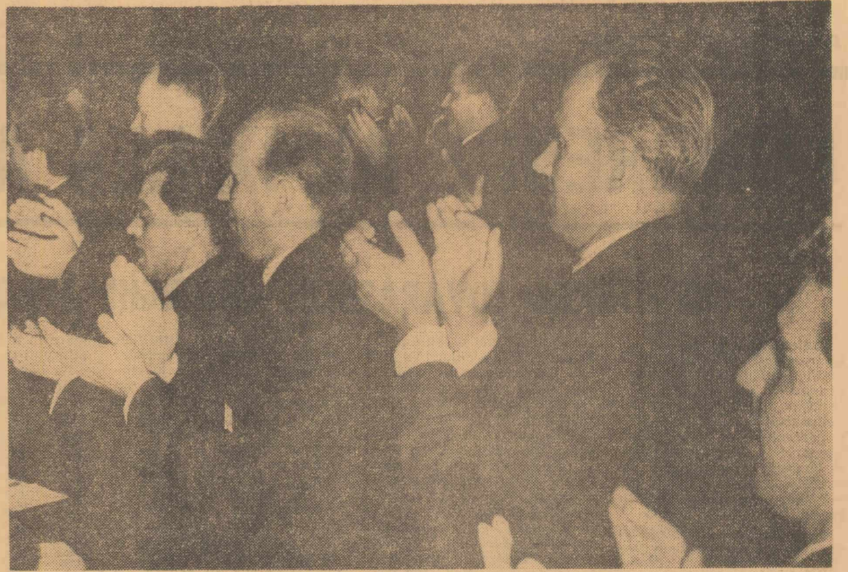
In timpul lucrărilor