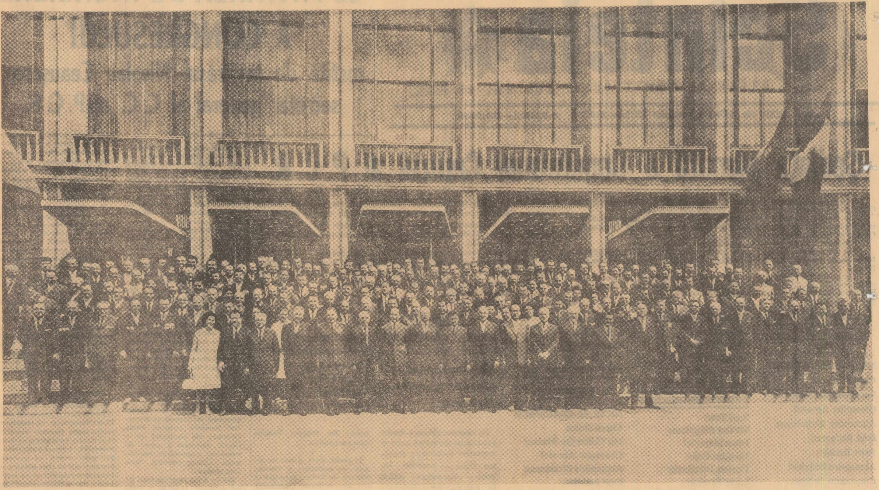
COMITETUL CENTRAL AL PARTIDULUI COMUNIST ROMÂN