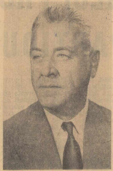
ION GHEORGHE MAURER