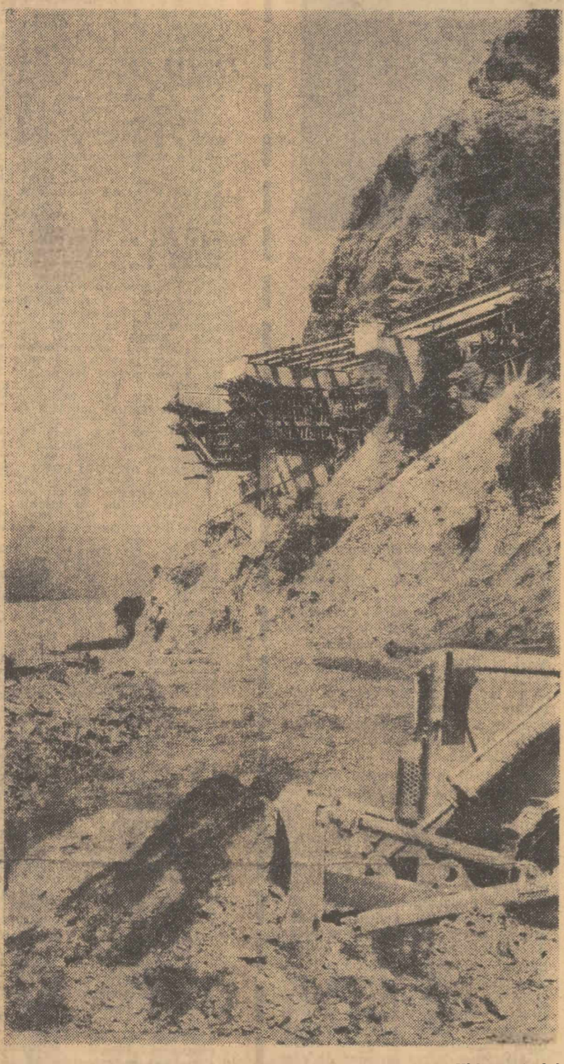
Lucrări de construcție a viaductului de pe șantierul Hidrocentralei Porțile de Fier.