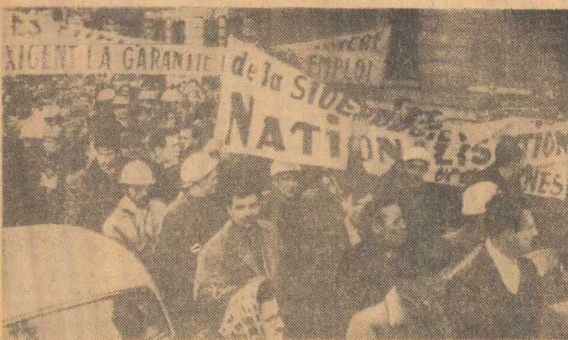
Demonstrații a minerilor din bazinul Lorena (Franța) împotriva planurilor monopolurilor de a închide un număr de mine

Ieșirea Singaporei din Federația Malayeză este considerată la Londra ca o lovitură extrem de puternică. Concepția care a stat la baza creării acestei federații s-a năruit, și întreaga politică britanică la est de Suez trebuie să fie revizuită... Capacitatea militară a Federației Malayeză se bazează în întregime pe forțele militare engleze, iar cei aproximativ 52.000 de soldați britanici care se află în această regiune împovărează în mare măsură bugetul militar al Marii Britanii... Desfășurarea Federației Malayeză pregătește noi greutăți guvernului britanic în sprijinirea intervenției americane în Vietnam. Pînă acum se conta pe sprijinul american în promovarea politicii britanice în această regiune a lumii, sprijin care și-a pierdut sensul în urma ieșirii Singaporei din Federația Malayeză.