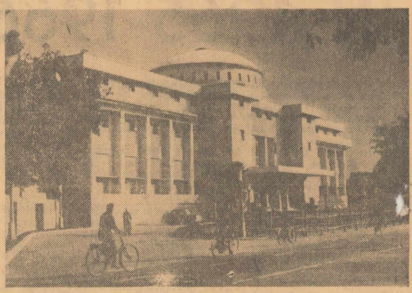
Imagina din capitala Indiei

Astăzi, poporul indian sărbătorește Ziua independenței — eveniment memorabil în istoria sa milenară. Se împlinesc 18 ani de cînd, la 15 august 1947, lupta grea și îndelungată pentru scuturarea jugului colonial a fost încununată de succes. Anglia fiind nevoită să-i cedeze independența, India a devenit un dominiu, iar scurtă vreme după aceea, în ianuarie 1950 — Republică suverană.