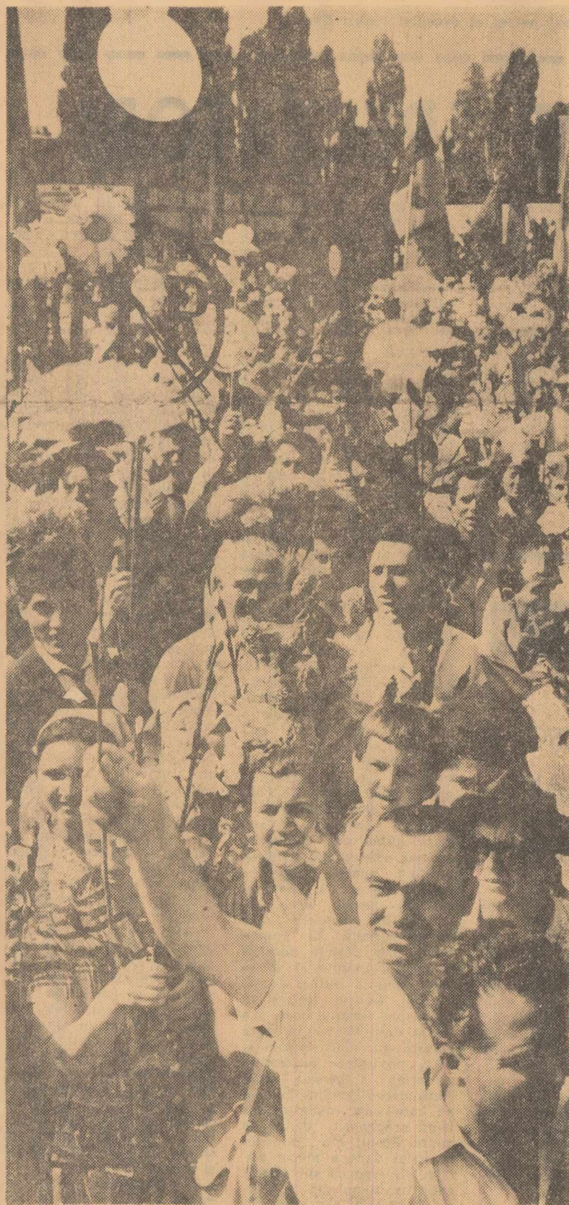
Flori de august, prinos al sentimentelor întregului popor pentru partid, pentru patria socialistă