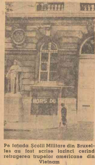
Pe fațada Școlii Militare din Bruxelles au fost scrise lozinci cerînd retragerea trupelor americane din Vietnam

La 22 și 24 august forțele aeriene americane au efectuat noi raiduri asupra teritoriului R. D. Vietnam, bombardînd și mitralînd centre populate și obiective industriale. Forțele anti-aeriene locale au doborât șase avioane inamice și au avariat numeroase altele. Numărul total al avioanelor americane doborîte începînd din 5 august 1964 se ridică la 491.