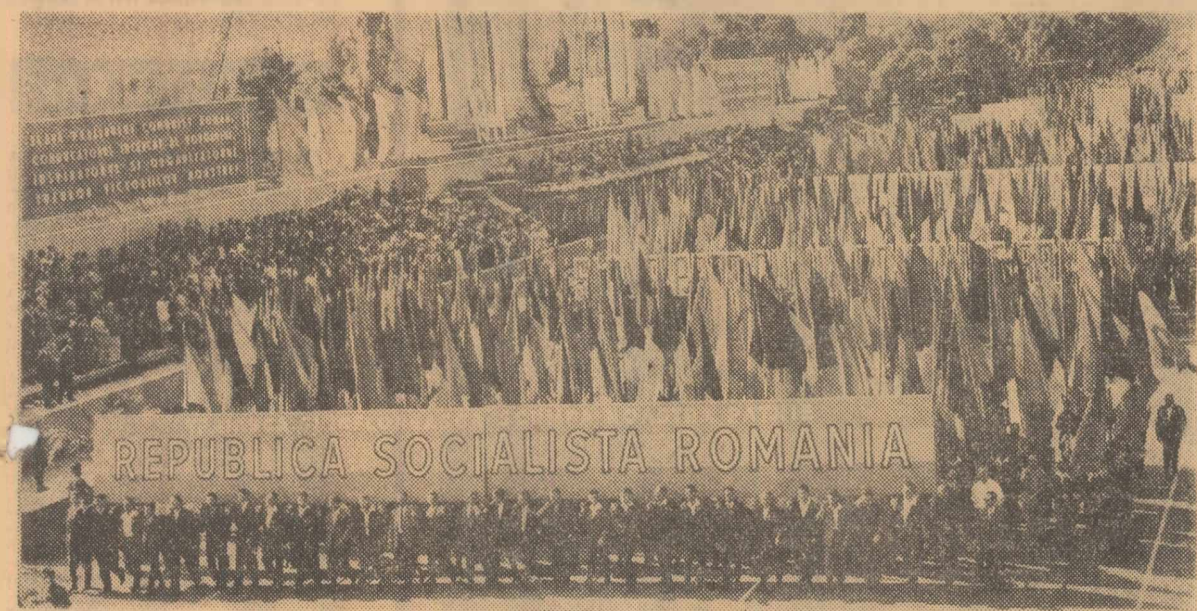
Numele scump al patriei socialiste, pe fondul înălțărilor al sindardelor