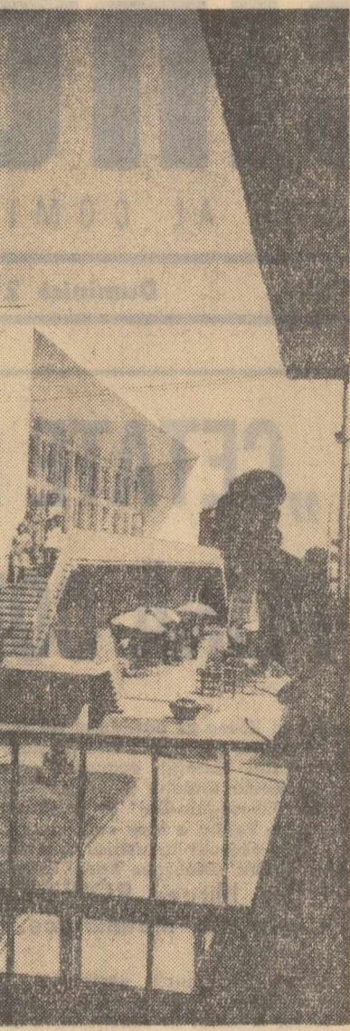
In stațiunea balneară Amara.

Participanții la conferințe și-au manifestat hotărîrea de a munci cu mai multă perseverență și spirit de răspundere pentru traducerea în viață a sarcinilor trasate agriculturii noastre socialiste de Congresul al IX-lea al partidului.