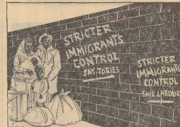
La Londra a fost dată recent publicității o Carte Albă care anunță poziția guvernului britanic de a cere de la țările Commonwealthului. El prevede restricții și mai aspre decât cele introduse de guvernul conservator, pe care, la timpul său, laboriștii le-au criticat energetic. Această identitate de poziții a celor două partide este satirizată în desenul de mai sus, reproducînd din revista „New Statesman”. Pe zid scrie: „Un mai strict control al imigranților spun constructorii”.

— În locul în care ne aflăm — continuă interlocutorul meu — era cimp. În toamna anului 1950 au început construcțiile. Doi ani mai tirziu au intrat în probe tehnologice o fabrică de acid sulfuric, realizată cu documentația și utilaj francez, și una de îngreșăminte fosfatice.