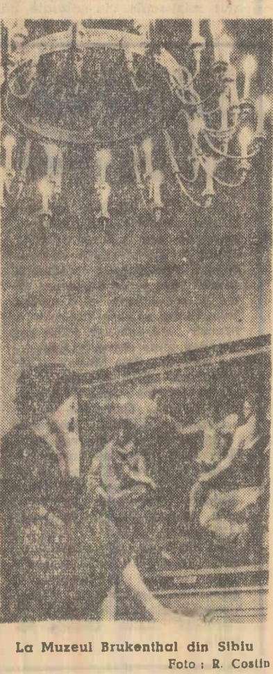
La Muzeul Brukenthal din Sibiu.

— Timpul noroșii pentru zilele de 30. 31 august și 1 septembrie. În țară: Vreme în ameliorare, cu cerul variabil. Ploi locale se vor semnala în nordul țării. Vînt slab pînă la intensitate moderată în creștere ușoară. Minimele vor fi cuprinse între 5 și 15 grade. În București: Vreme în ameliorare. Cer variabil. Vînt slab pînă la intensitate moderată. Minimele vor fi cuprinse între 5 și 15 grade. În Brașov: Vreme în ameliorare. Cer variabil. Vînt slab pînă la intensitate moderată. Minimele vor fi cuprinse între 5 și 15 grade.