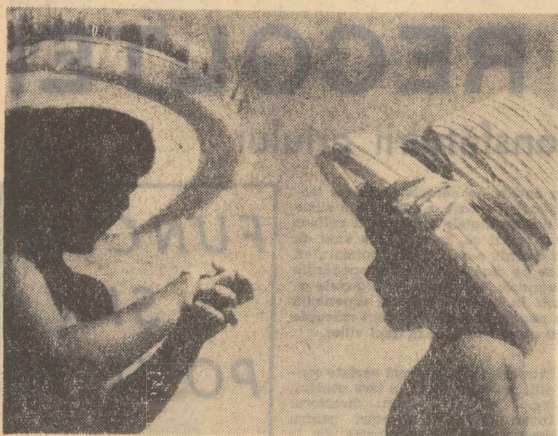
Ghici. Ce am în palme?