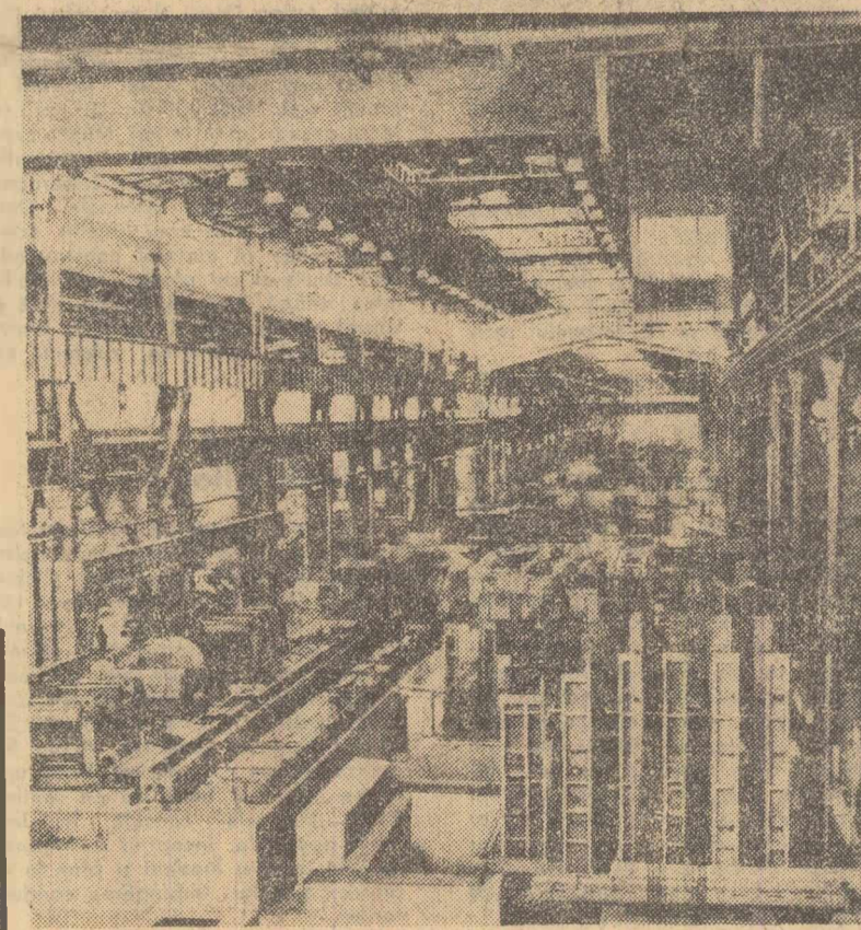
În haia laminorului de tablă grosă