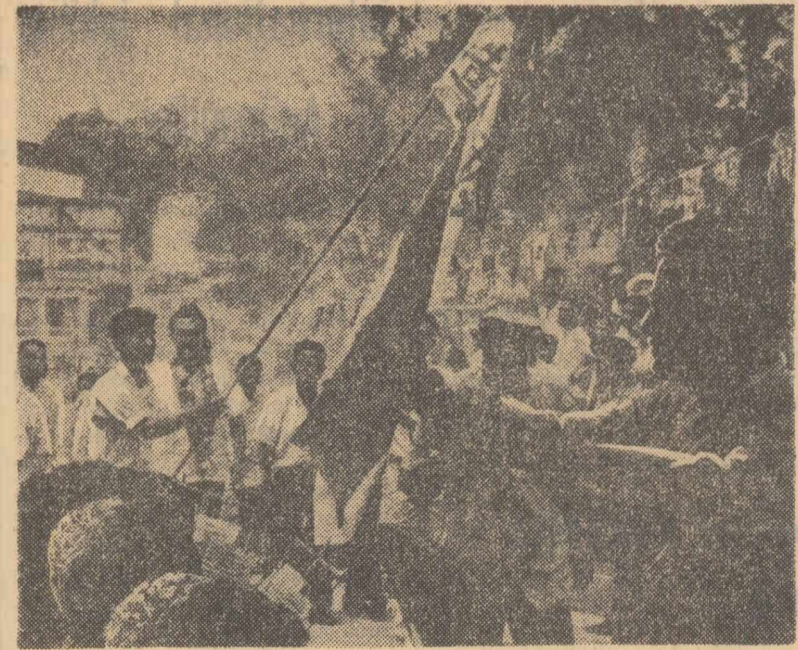
Pe o stradă din Singapore după desprinderea acestui stat din Federația Malayeză

TOKIO 28 (Agerpres). — Secretarul general al Partidului Socialist din Japonia, Tomomi Narita, a declarat în cadrul unei conferințe de presă că Partidul Socialist din Japonia va depune toate eforturile pentru a împiedica ratificarea tratatului japono-sud-coreean. În acest scop, a spus el, socialiștii vor propune în parlament crearea unui front unit al tuturor partidelor de opoziție.