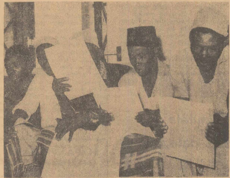
În mica insulă de pe coasta răsăriteană a Africii, Zanzibar (Republica Unită Tanzania) țărani săraci au început să primească pămînt. Ca urmare a exproprierii latifundiilor feudale, 800 de țărani cu primit certificate care le dau dreptul de folosință asupra a 3 acri de pămînt. În fotografie: țărani citînd certificatele de folosință a pămîntului.