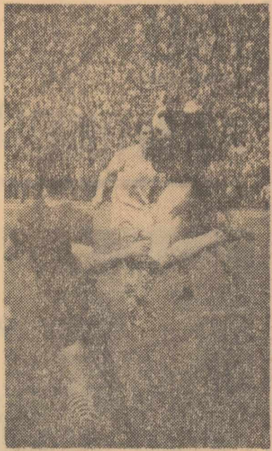
Pericol la poarta ploieștenilor (fază din meciul Rapid — Petrolul Ploiești)