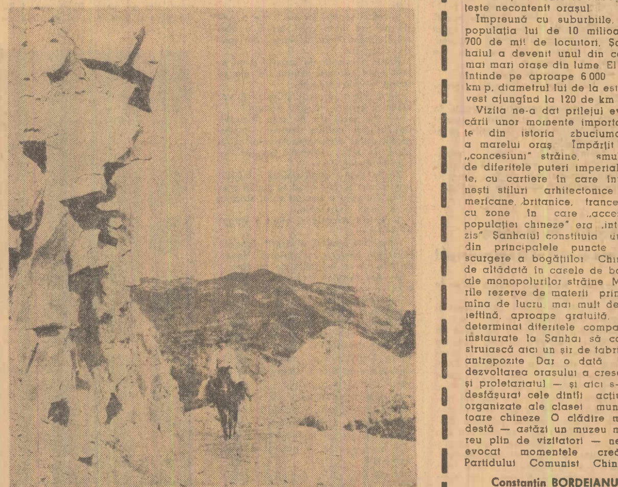
În drum spre Vrîncioala