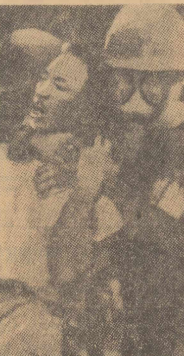
Agentele de presă anunță că duminică dimineață autoritățile sud-coreene au arestat 4 generali în rezervă, cunoscuți ca opozanți ai guvernului Pak Cijan Hi. Este vorba de Kim Hong-II, fost ministru al afacerilor externe, de Pak Byong Kwon, fost ministru al apărării, de Kim Jai Chun, fost director al serviciului central de informații sud-coreean, și Pak Won Bin, fost ministru fără portofoliu. Cei patru sînt acuzați oficial de „defaimare” a președintelui Pak Cijan Hi, concretizată într-o declarație pe care au dat-o publicității în momentul în care manifestările studențești împotriva tratatului japoano-sud-coreean au ajuns la punctul lor culminant. În declarație, aceștia criticau hotărîrea lui Pak Cijan Hi de a reurge la armată pentru a înăbuși demonstrațiile.

Pe de altă parte, în ciuda interdicției guvernamentale, aproximativ 300 de studenți s-au intrunit în centrul universitar din Seul pentru a protesta împotriva folosirii armatei la reprimarea acțiunilor studențești. Politia a intervenit arestînd 190 de studenți. În fotografie: La Seul în timpul ciocnirilor dintre studenți și armată.