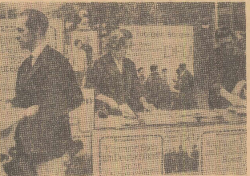
Düsseldorf. În fața unui stand al partidului Unirea păcii din Germania

În ultima vreme se înmulțesc declarațiile în favoarea extinderii relațiilor cu țările socialiste, declara-