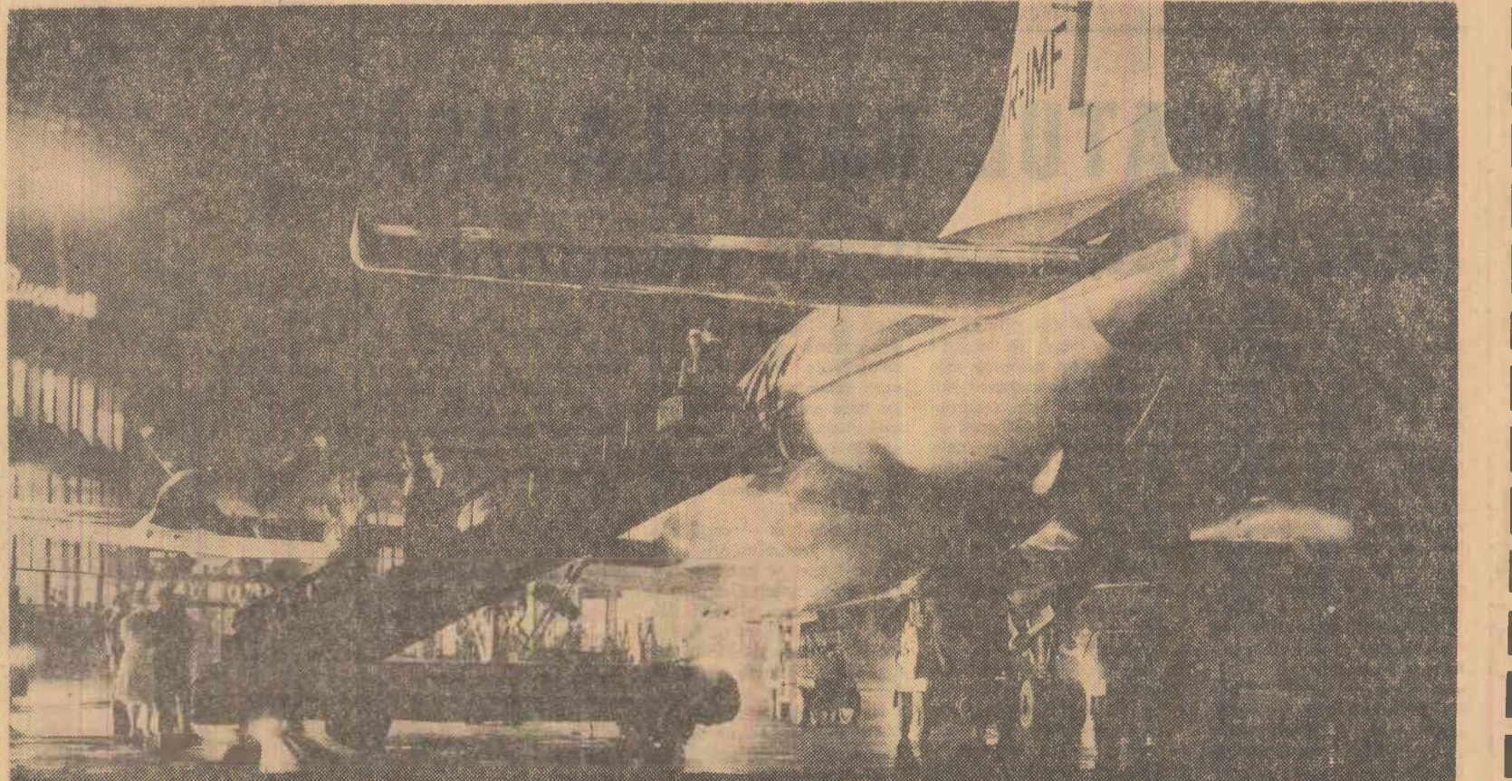
Noaptea pe aeroportul Băneasa

— La-ai văzut? întrebă inginerul. — Numai capul.