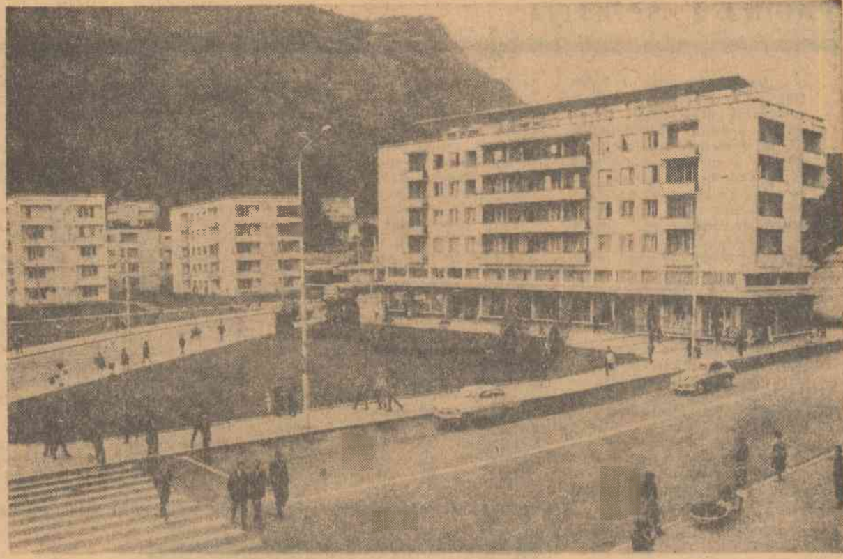
Brașov. Piața teatrului