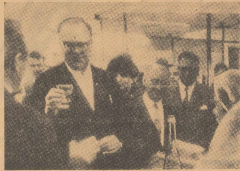
Tirgul internațional de bunuri de larg consum de la Stockholm. Primul ministru suedez, Tage Erlander, vizitează pavilionul Republicii Socialiste România.

BOGOTA 2 (Agerpres). — După aproape o lună de criză guvernamentală, președintele Columbiei, Guillermo Leon Valencia, a reușit