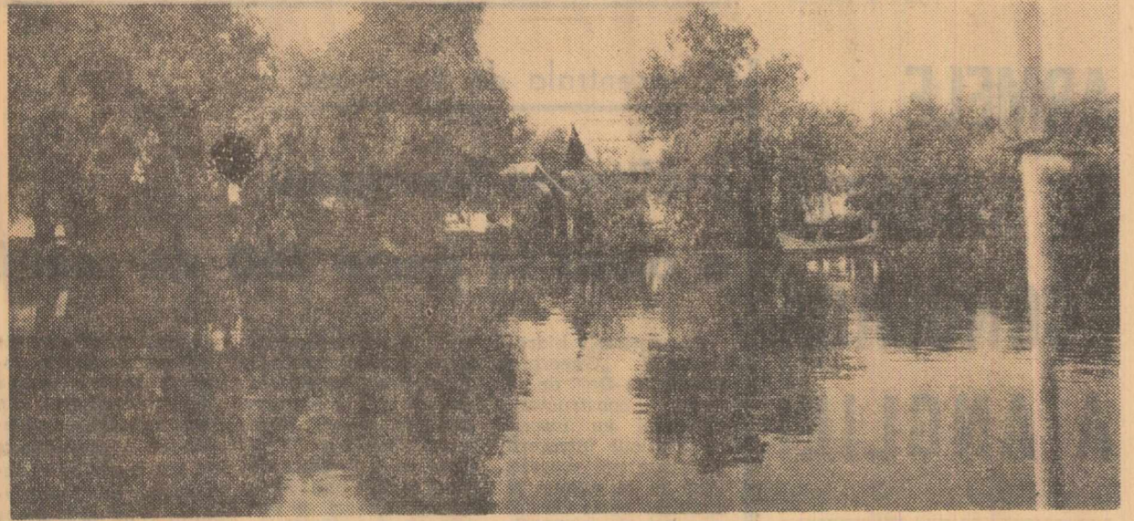
In Delta Dunării