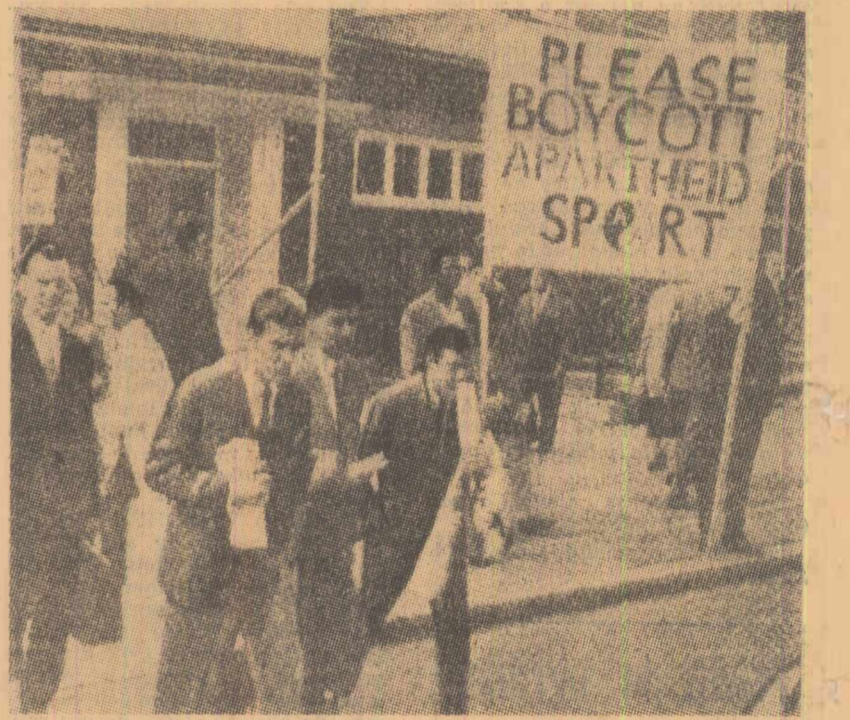
LONDRA: Demonstrație împotriva politicii de apartheid promovată de autoritățile din Republica Sud-Africană.