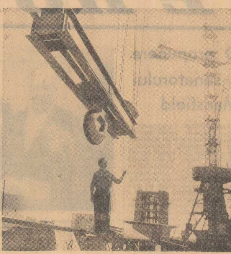
Lucrări de extindere a termocentralei Luduș-Iernut