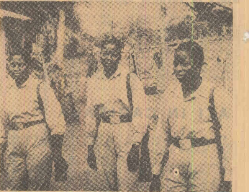
ANGOLA: În rîndurile patrioților luptă și femei. Aceste trei fete au venit din interiorul țării

Anunțînd această hotărîre a guvernului, ministrul educației, Kwon O-Byung, a declarat că universitățile „Korea” și „Yonsei” își întreprind activitatea pînă cînd se va constata că conducerea lor a luat toate măsurile pentru a preveni demonstrațiile studenților de aici. În ciuda acestei măsuri guvernamentale, un purtător de cuvînt al studenților a declarat că demonstrațiile împotriva tratatului privind așa-numita normalizare a relațiilor japono-sud-coreene nu vor înceta.