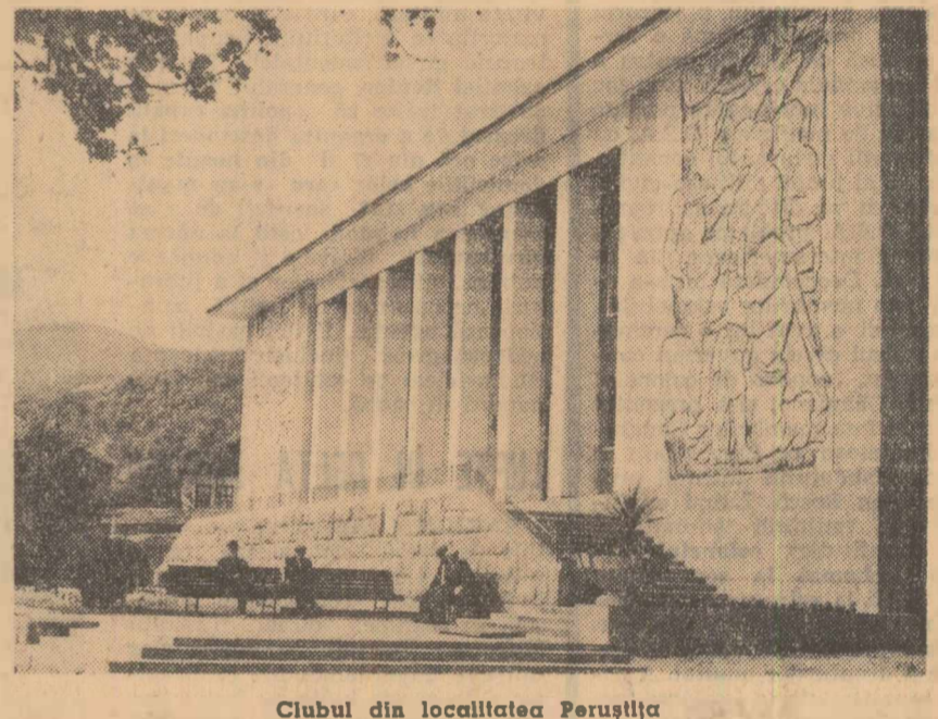
Clubul din localitatea Peruşlița

În partea de sud a Sofiei se construiesc un orașel studentesc pentru 35.000 de tineri. Aici vor fi concentrate Institutele superioare pentru științe tehnice: de mașini electrotehnice, chimico-tehnologic, construcții, de mine și geologie. Tot aici va fi construit și Institutul superior de cultură fizică. Blocurile institutelor vor avea câte 4 etaje, iar căminele studențești câte 10 — 11 etaje.