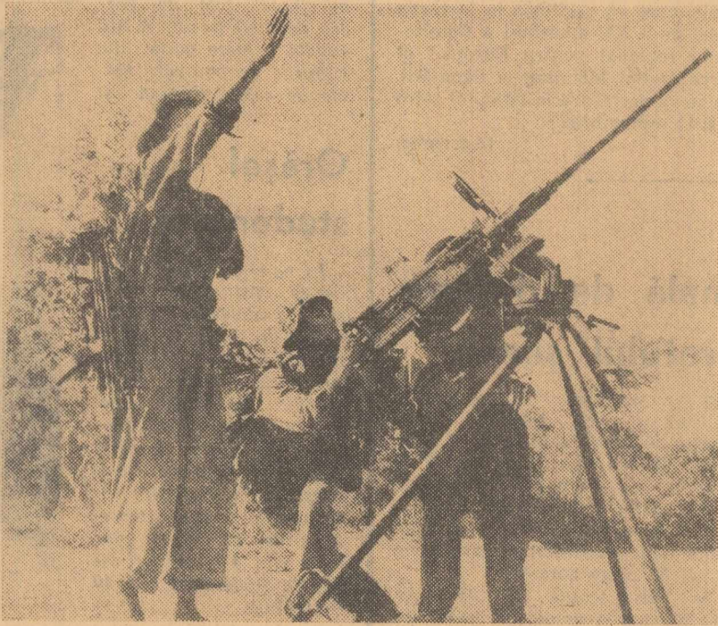
VIETNAMUL DE SUD: Armata de eliberare instalează mitraliere anti-aeriene mobile pentru a da replica binemeritată avioanelor inamice

patriotice în regiunea situată la circa 200 km sud-est de Saigon împotriva unor posturi guvernamentale întărite. Pierderile suferite de garnizoana atacată, transmite agenția France Presse din Saigon, sînt considerabile. În cursul zilei de sîmbătă, avioane americane strategice de tipul „B-52” au decolat de la baza din Guam efectuînd noi bombardamente asupra regiunii Quang Binh, precum și asupra altor localități din zona platurilor centrale, unde se consideră că există poziții întărite ale patrioților sud-vietnamezi.