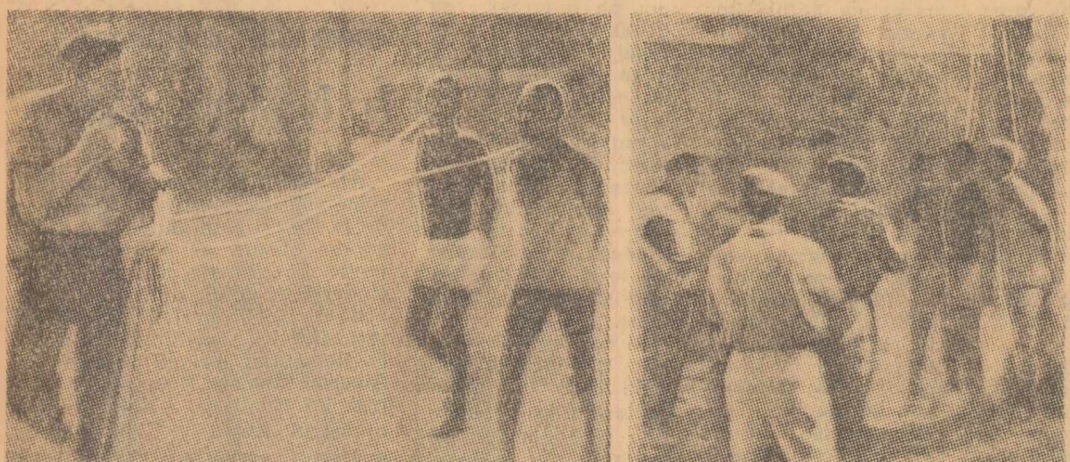
Două măturări zguduitoare, aduse în Europa de un mercenar pentru „albumul de familie”, și publicate de săptămânalul englez „Observer”. Un mercenar al lui Chombe duce la spinzurtoare doi pașii congolezi. Sădăcuț zimbăște. Mercenarii se ceartă (fotografia din dreapta), cine să-și spinzure — sint prea mulți amatori. Ultima „distracție” a acestor brute este „cine omoară mai repede un congolez”. Știrile de joi anunță că pașii congolezi au atacat două orașe din provincia Kivu