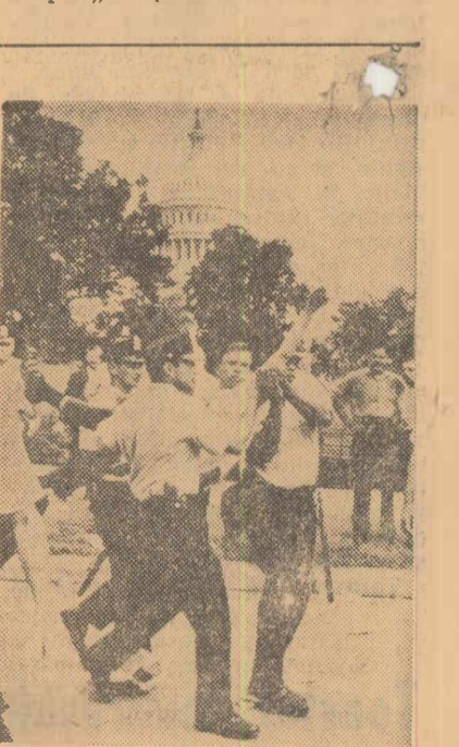
În fața Capitoliului din Washington a avut loc o manifestație împotriva politicii americane în Vietnam. Poziția a intervenit arestând peste 100 de demonstrații

În legătură cu problemele Pieței comune, el a subliniat că „Italia consideră ca sarcină a sa soluționarea dificultăților actuale ale Pieței comune și dorește participarea activă a Franței pentru a asigura activitatea normală a Comunității europene, în vederea înfruntării problemelor interne și a convorbirilor internaționale la care participă „cel șase”.