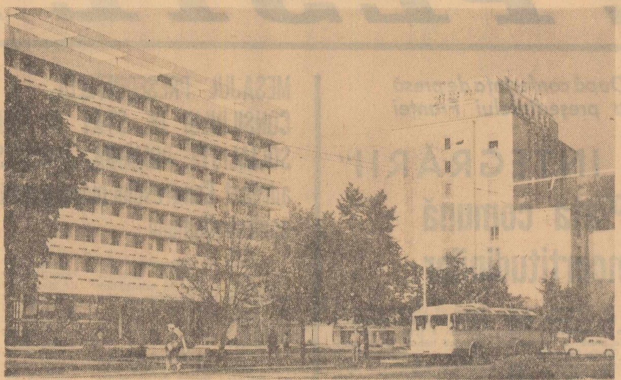
Noua clădire de pe lângă hotelul „Carpați” din Brașov