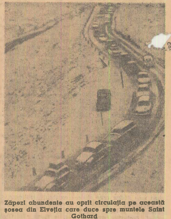
Zăpezii abundente au oprit circulația pe această șosea din Elveția care duce spre muntele Saint Gotthard