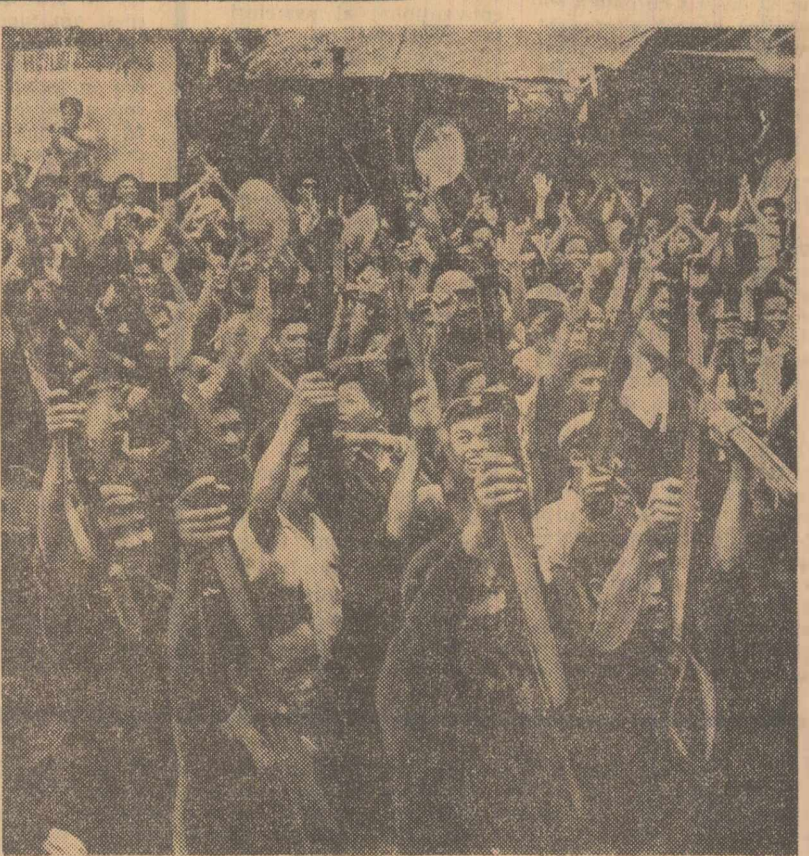
La Hanoi (fotografia de sus) și în multe localități ale Republicii Democratice Vietnam a fost marcată doborîrea celui de-al 500-lea avion agresor