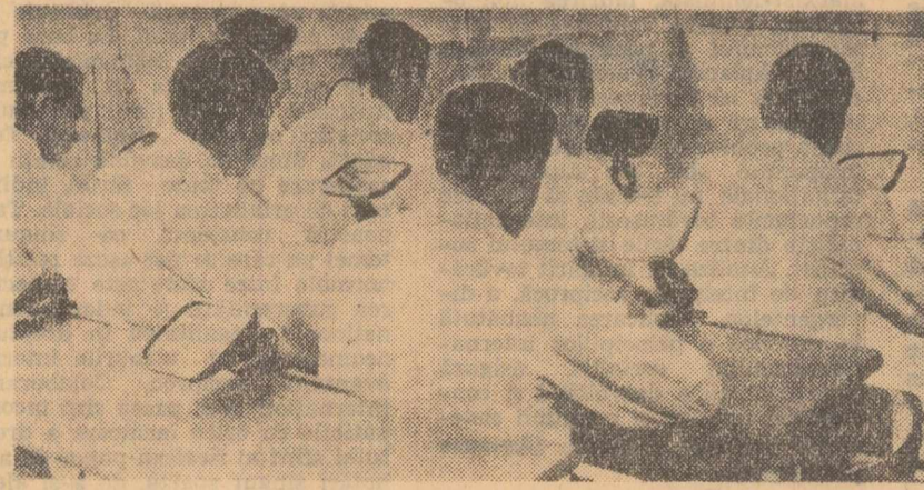
In Franța, televiziunea își croștește drum în învățămînt. Imaginea de pe ecranul special, fixat în tavan, este urmărită în oglinda reglabilă de pe pupitrul. Lumina zilei nu împiedică studenții să ia note după cursul televizat

Desigur, calculatoarele electronice ale viitorului vor avea performanțe mult superioare celor actuale — vitezăți mai mare, capacitate sporită a memoriei, dimensiuni mai mici — devenind instrumente ieftine și produse în serie. Vor fi urmașii celor peste 20 000 de calculatoare electronice care există astăzi în lume. Pentru a apropia viitorul este necesar ca și la noi să se acorde multă atenție cercetărilor în acest domeniu, introducerii și utilizării calculatoarelor electronice.