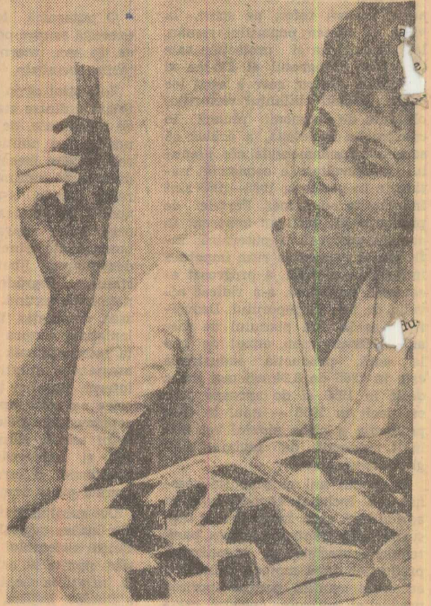
Sînt doar 32, micile plăci fotografice, pe care un fascicul de electroni a imprimat șeme minuscule, reprezentînd numele, adresa și numărul a 800 000 abonați telefonic din New York. Decl o carte de telefon electronică

Mai bine de jumătate de veac în urmă, se descopereau o metodă de investigație a corpurilor solide cristaline care urma să contribuie substanțial la progresul cercetării științifice. Cu ajutorul razelor X, raziții ce au aceeași natură ca și lumina pe care o vedem, doar la lungimi de undă de cîteva mii de ori mai mici, se putea stabili modul în care sînt așezate atomii de diferite tipuri în corpul studiat. De-a lungul anilor, perfecționarea tehnicilor de lucru a condus la lărgirea informațiilor privitoare la modul de aranjare a atomilor în cristale, la posibilitatea de a studia structura corpurilor solide amorphe, lichide sau gazoase. Modul de aranjare a atomilor poate fi stabilit chiar și atunci cînd modelul de bază al corpului, molecula sau gruparea de atomi, este constituit din