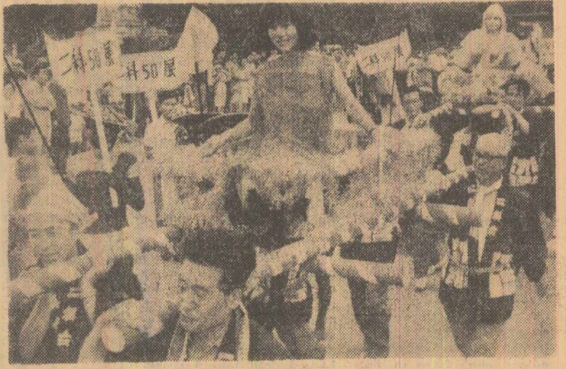
Paradă la Tokio cu prilejul deschiderii sezonului artelor

ROMA. Președintele Consiliului de Miniștri al Italiei, Aldo Moro, a anunțat oficial că guvernul ita-