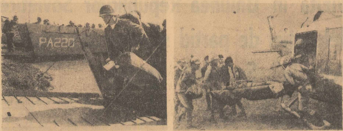
Imagini surprinse de obiectivul aparatului de fotografiat în Vietnamul de sud. Militarii din infanteria marină a S.U.A. debarcă de pe un vas de transport pe plaja de la Chu Lai (în stînga). Trupe americane și sîngoneze „se întorc” dintr-o operație împotriva forțelor patriotice