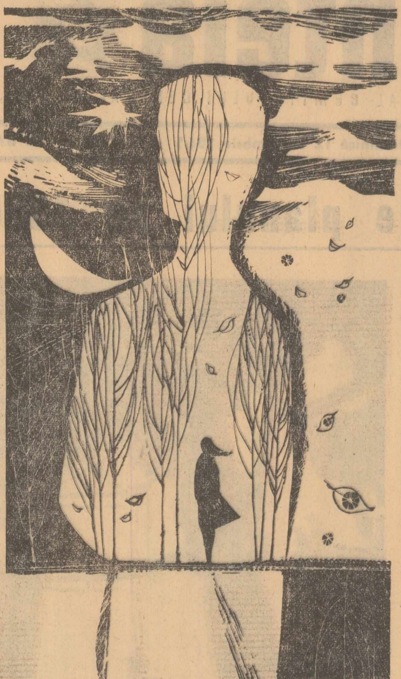
Ilustrație de MIHU VULCANESCU la poezia „RODICA”

Așa cum spunea poetul Nicolae Bălcescu, „am făcut, la un loc, pretutîndeni multe proiecte lumina această”. A mers