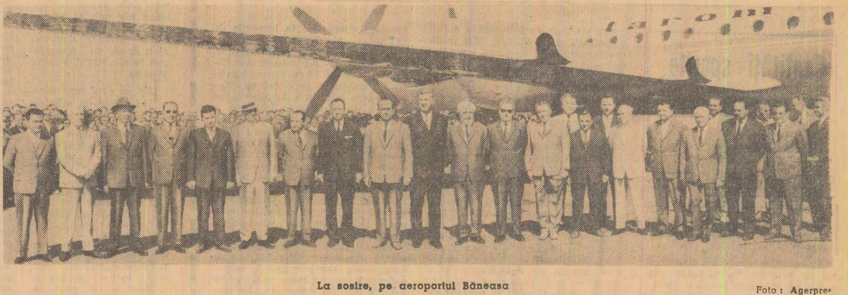
La sosire, pe aeroportul Băneasa.

Trăiască Partidul Comunist al Uniunii Sovietice! Trăiască prietenia româno-sovietică! La revedere, dragi tovarăși și prieteni!