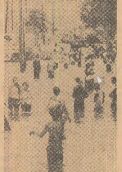
Pe străzile orașului New Orleans după inundațiile provocate de uraganul Betsy

NEW YORK. Uraganul „Betsy” care s-a abătut vineri asupra statului Louisiana a produs pagube care pot fi evaluate la peste o sută de milioane de dolari.