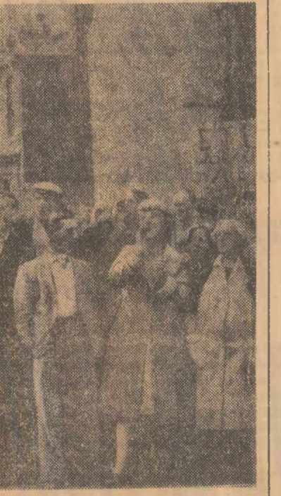
La Sheffield în Anglia a avut loc o manifestație a membrilor sindicatalui metalurgicilor din orașul Dunford and Elliott, cerînd recunoașterea de către autorități a organizației lor

ATENA. În capitala Greciei s-au deschis lucrările celui de-al 16-lea Congres al Federației internaționale de astronomie, la care participă peste 1.500 de savanți și tehnicieni în domeniul cercetărilor spațiale din 45 de țări. Din partea Republicii Socialiste România la congres ia parte acad. Elie Carajoli.