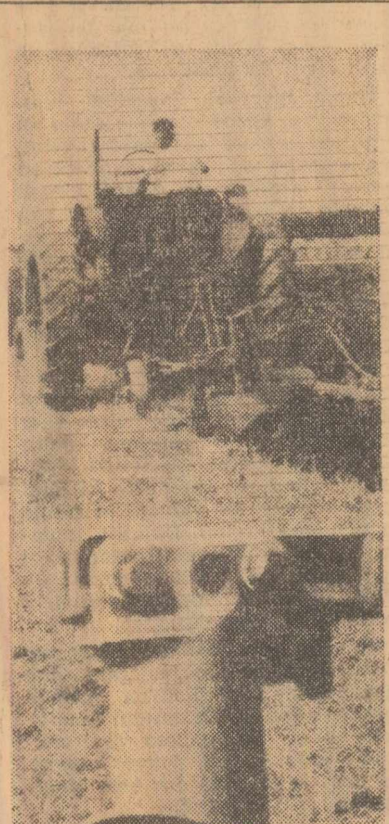
Pregătirea terenului în vederea însămînțării de toamnă la cooperativa agricolă de producție Sărînga, regiunea Ploiești