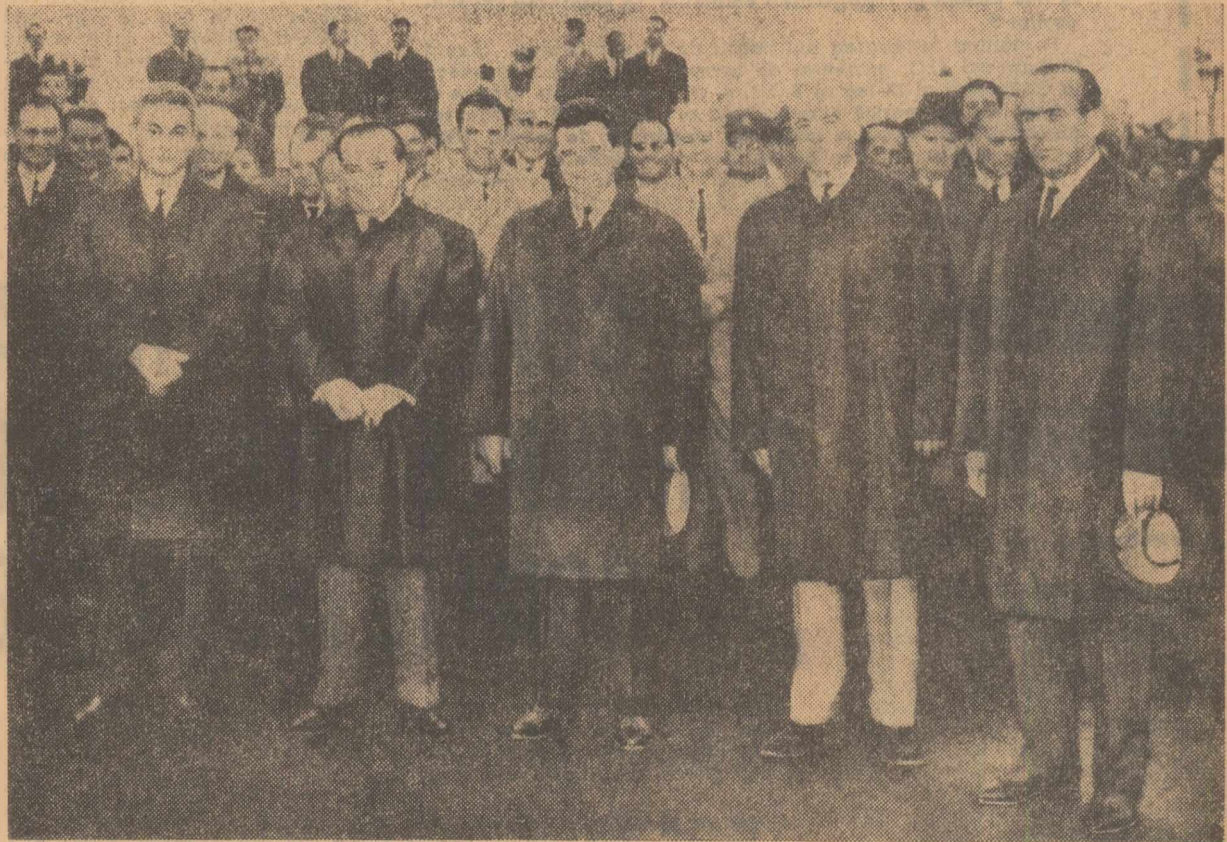
La plecare, pe aeroportul Băneasa