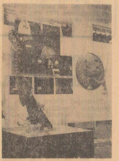
Creații ale artiștilor păpușari români