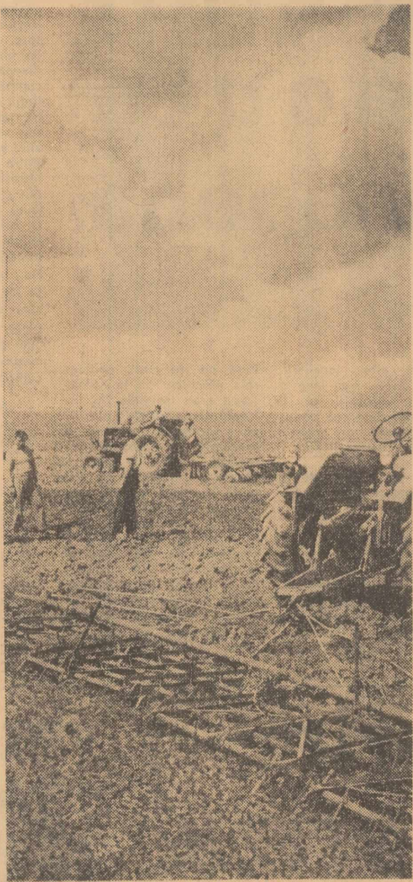
Pregătirea terenului pentru semănat la cooperativa agricolă de producție Adunații Copcănel, raionul Gurju

Anul acesta, datorită condițiilor climatice deosebite, specialiștii recomandă ca semănatul culturilor de toamnă să înceapă mai devreme decât în alți ani și să se termine într-un timp cât mai scurt. Până acum în gospodăriile de stat au fost arate pentru însămînțările de toamnă 80 la sută din terenurile prevăzute, iar în cooperativele agricole peste 60 la sută. Au continuat, de asemenea, condiționarea semințelor și recoltarea culturilor țirzii. Pe măsură ce se pregătește terenul, este necesar ca pretutindeni unitățile agricole să treacă cu toate forțele la semănat.