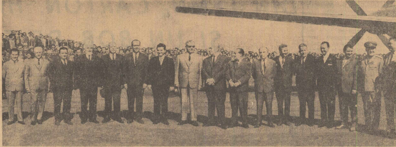
La sosire, pe aeroportul Băneasa

Sâmbătă dimineața s-a înnoptat în Capitală, venind de la Sofia, delegația de partid și guvernamentală a Republicii Socialiste România, în frunte cu tovarășul Nicolae Ceaușescu, secretar general al Comitetului Central al Partidului Comunist Român, care, la invitația Comitetului Central al Partidului Comunist Bulgar și a Consiliului de Miniștri al Republicii Populare Bulgaria, a făcut o vizită oficială în această țară. Din delegație au