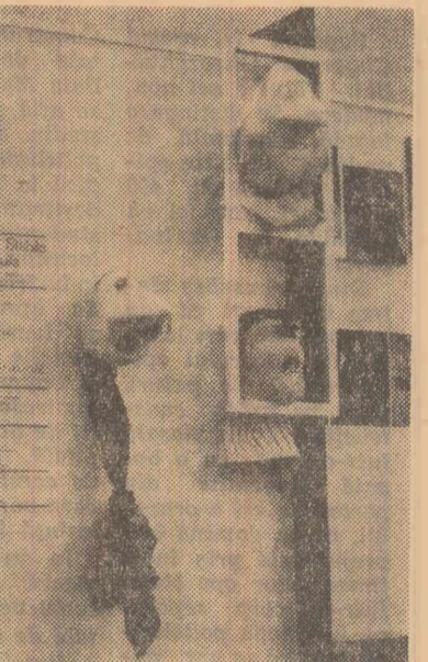
Standul teatrului „Stabile dell'Aquila”-Italia