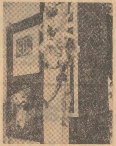
Standul teatrului de păpuși din Moscova

Pe panourile expoziției, păpușile reprezintă o atracție permanentă pentru vizitatori