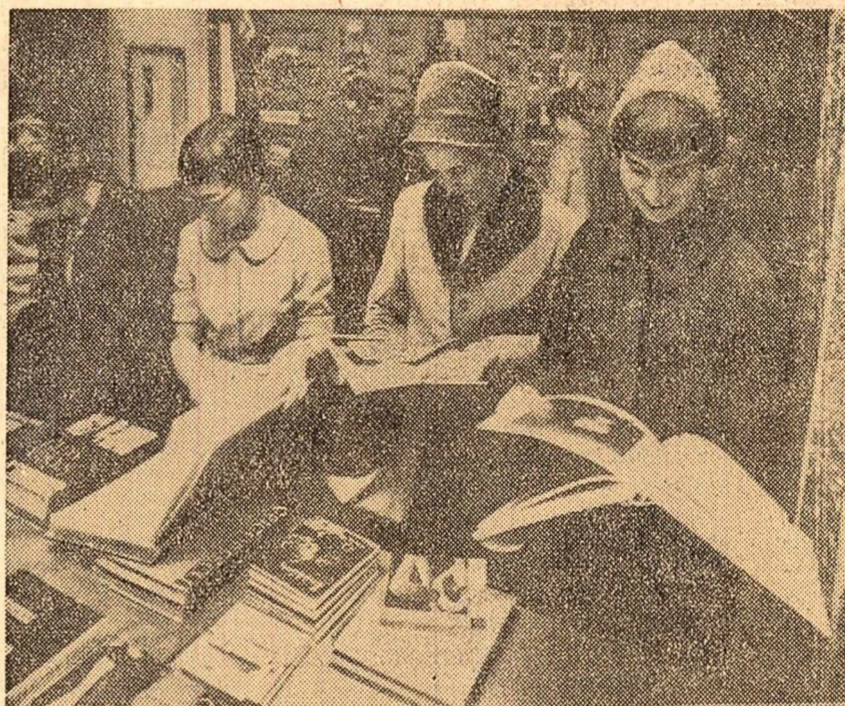
Vizitând expoziția cărții românești deschisă la Universitatea din Uppsala (Suedia)