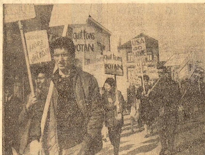
Locuitorii orașului Florennes (Belgia) au organizat un marș de protest împotriva staționării armamentului nuclear la baza americană din orașul lor