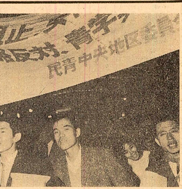
Print-o manevră, comitetul special al Camerei Inferioare a Parlamentului japonez a ratificat ieri tratatul japoano-sud-coreean, ceea ce reflectă graba anumitor cercuri de a obține aprobarea tratatului în cele două camere ale parlamentului. Între timp, la Tokio, după cum se vede și din fotografie, continuă demonstrațiile pentru anularea tratatului.