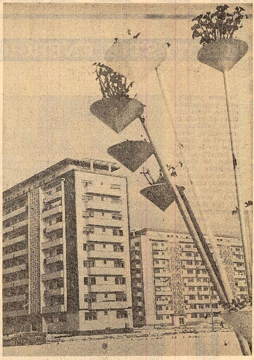
Ploștii, cartierul Nord

În cadrul marilor aniversări culturale recomandate de Consiliul Mondial al Păcii, joi seara a avut loc în studioul de concert al Radioteleviziunii o festivitate consacrată împlinirii a 100 de ani de la nașterea compozitorului finlandez Sibelius.