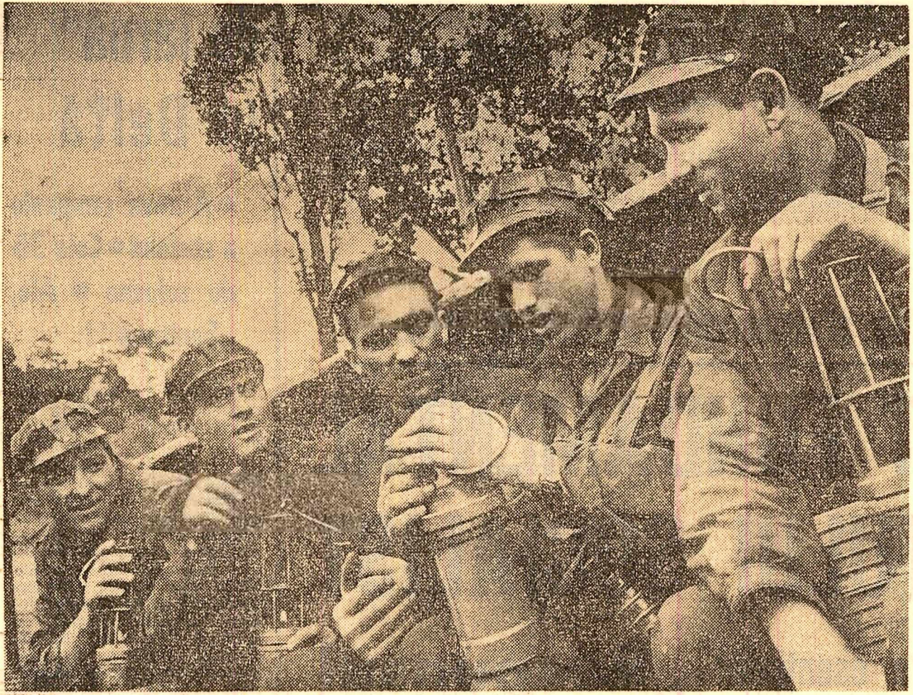
Înainte de intrarea în șut (La exploatarea minieră Lupeni)