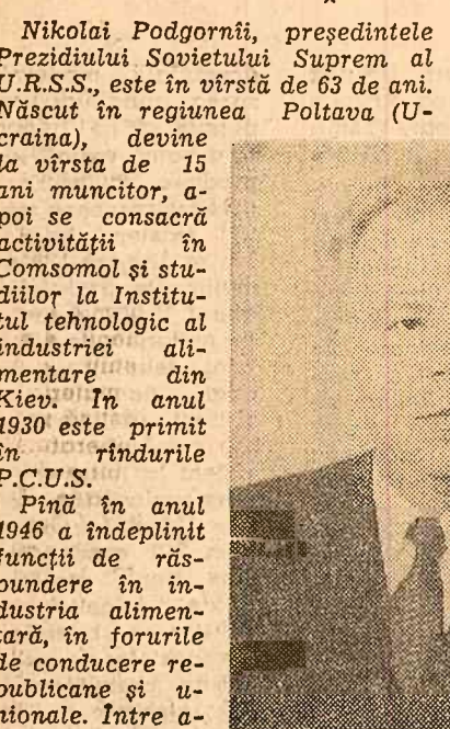
Nikolai Podgornii, președintele Prezidiului Sovietului Suprem al U.R.S.S., este în vîrstă de 63 de ani. Născut în regiunea Poltava (Ucraina), devine la vârsta de 15 ani muncitor, apoi se consacră activității în Comsomol și studiilor la Institutul tehnologic al industriei alimentare din Kiev. În anul 1930 este primit în vîrstărie P.C.U.S. Pînă în anul 1946 a îndeplinit funcții de răspundere în industria alimentară, în forurile de conducere republicane și unionale. Între anii 1946 — 1950, N. Podgornii a reprezentat Consiliul de Miniștri al Ucrainei pe lingv guvernului U.R.S.S., iar apoi a trecut în activitatea de partid, fiind prim-secretar al Comitetului

Fostul ministru al apărării în guvernul Papandreu, Garoufalas, a refuzat să facă parte din noul partid, anunțînd că va rămîne „independent”.