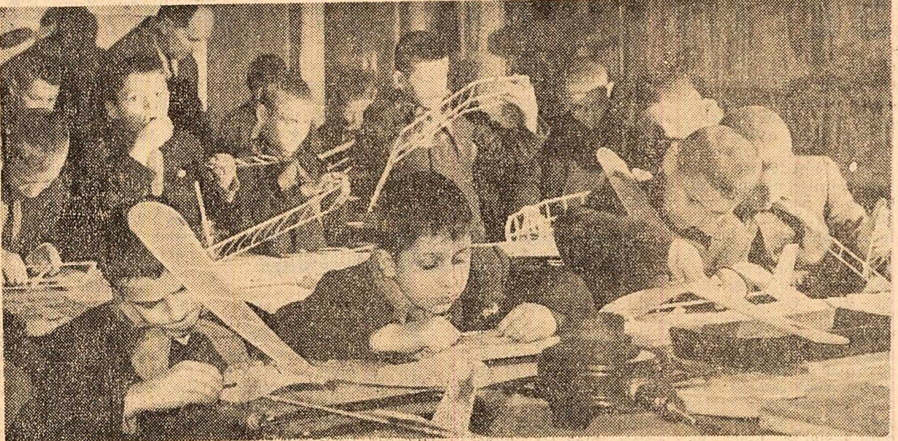
Aeromodulismul — o îndeletnicire plăcută și interesantă pentru zilele de vacanță. (La Casa pionierilor din Suceava)

În distribuție aflăm cunoscutul nume ale scenei de ecranul nostru, alături de actorii noștri.