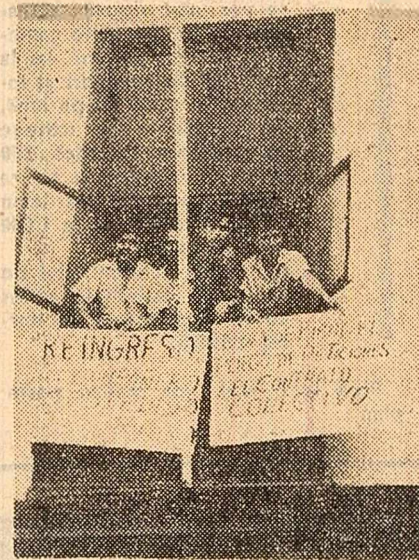
ECUADOR. Muncitorii unei fabrici din Guayaquil au declarat grevă, ocupând întreprinderea. În fotografie: Greviști într-una din secțiile fabricii

WASHINGTON 15 (Agerpres). — În capitala statului Georgia (S.U.A.) a avut loc o manifestație a populației de culoare, condusă de Martin Luther King, laureat al premiului Nobel pentru pace. Participanții au protestat împotriva hotărârii Curții federale a statului Georgia de a interzice lui Julian Bond să-și ocupe locul în organul suprem al statului, sub pretextul că a semnat o declarație care condamnă agresiunea Statelor Unite în Vietnam. (Julian Bond a fost ales cu o majoritate de 80 la sută ca reprezentant al populației de culoare în Camera Reprezentanților din statul Georgia).