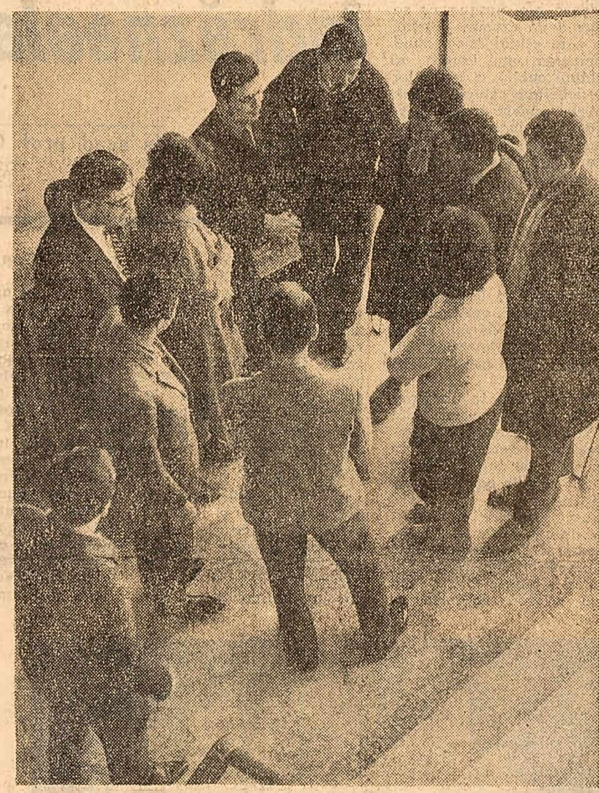
Înainte de examene, schimb de păreri între studenți constructori din Capitală.