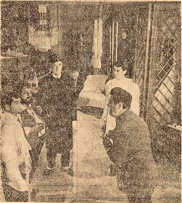
La studiourile din Buftea a inceput turnarea noului film artistic 'Nimic nou, Dr. Faust', in regia lui Ion Popescu-Gopo