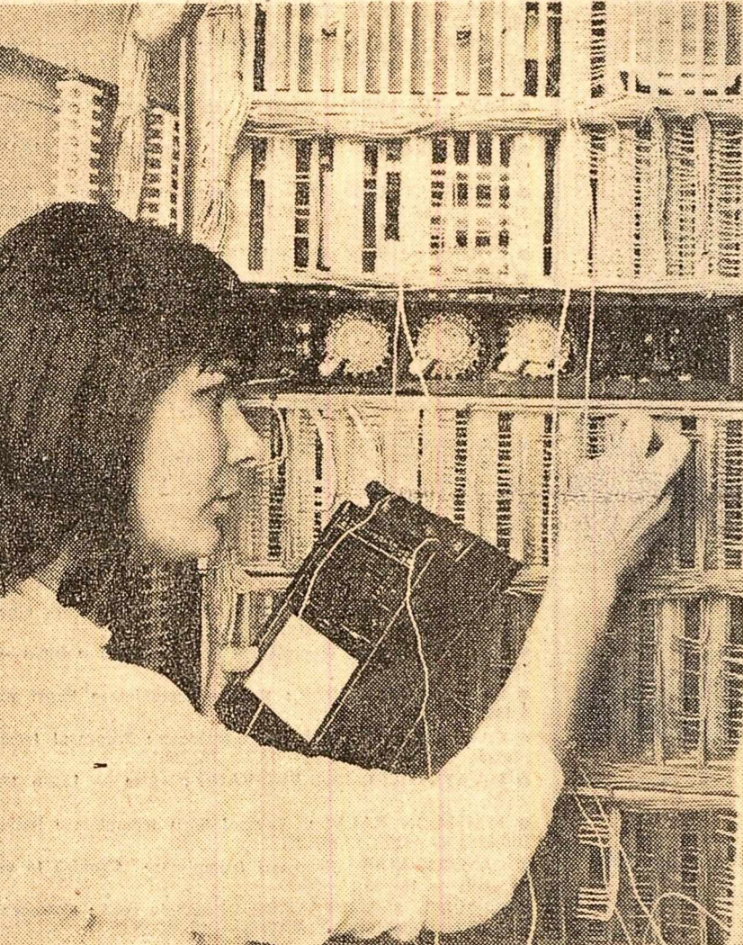
Controlul continuității cablajului la una din instalațiile laminorului Bluming de la Hunedoara