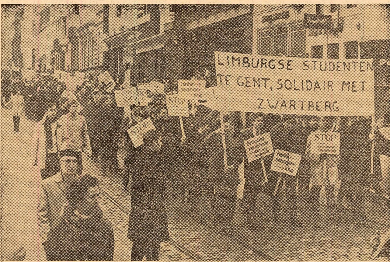
După cum s-a mai anunțat, în ultimul timp în Belgia a avut loc un șir de greve ale minerilor din regiunea carboniferă Limburg...