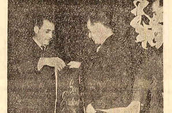
La Uzina de mecanică din Capitală se înmânează distincții pentru succesele obținute în întrecerea socialistă pe 1985

● Miercuri la liceul nr. 38, acad. Iorgu Iordan a vorbit profesorilor și elevilor în cadrul unei serii literare despre „Limba literară a lui I. L. Caragiale”. Ecaterina Logadi, fiica mareului scriitor, a vorbit despre Caragiale omul.