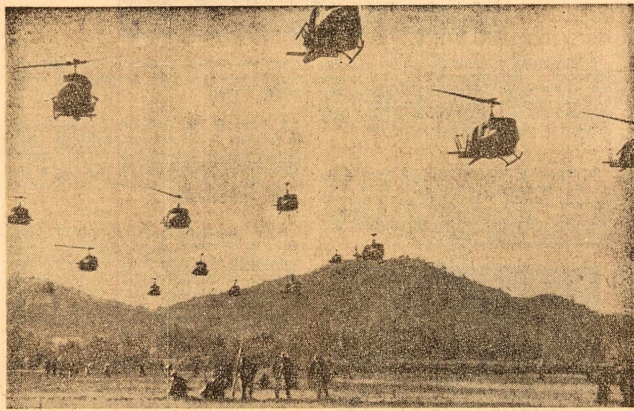
Operațiunea „Vulturul cu două capete”, cea mai mare „acțiune de curățire” întreprinsă de trupele americane în Vietnam...