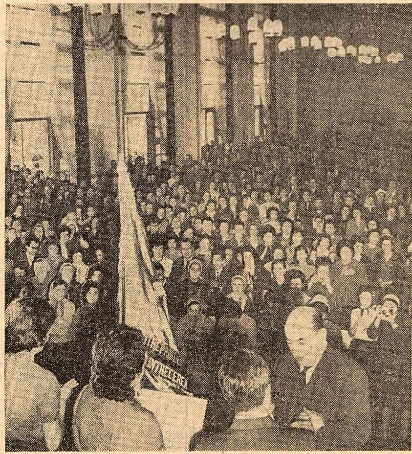
Muncitorii, inginerii și tehnicienii Fabricii de confecții și tricotaje București au primit ieri Steagul roșu și diploma de întreprindere fruntașă pentru anul 1965. În 1965 ei au livrat peste plan 520.000 tricotașe și confecții obținând economii suplimentare în valoare de aproape 10 milioane de lei. Totodată, au fost depășiiți simțitor indicatorii de calitate la numeroase produse și s-au introdus în fabricație foarte multe modele noi