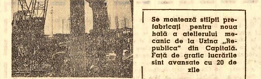
Se montează stâlpii prefabricați pentru noua hală a atelierului mecanic de la Uzina „Republica” din Capitală.