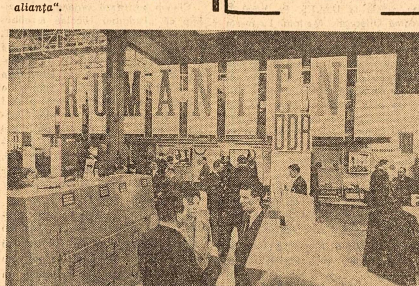
La Tîrgul de primăvară de la Leipzig, Republica Socialistă România se prezintă cu un birou comercial. Aici sînt expuse cîteva din noul produse ale industriei țării noastre. Atrag atenția, în mod deosebit, produsele industriei constructoare de mașini

„Analiza arată că autoritatea militară reală în interiorul N.A.T.O. depinde de președintele Statelor Unite. Această situație provine din faptul că alianța depinde de armele nucleare americane. Totalul comandamentelor în activitate ale N.A.T.O. și al delegațiilor superioare reprezintă șapte americani, opt britanici, un francez și un belgian. Printre acești șapte americani se află cei doi comandanți-șefi ai comandamentelor „Saceur” și „Saclant”. Dat fiind că doi din cei opt reprezentanți ai Marii Britanii sînt delegați cu o putere relativ slabă, se va remarcă ușor că Statele Unite au dominat dintotdeauna în sinul N.A.T.O., britanicii aflîndu-se pe locul doi, francezii pe locul trei. Celelalte țări n-au nici o poziție importantă. Reforma bazei N.A.T.O. este deci necesară, oricare ar fi decizia franceză de a rămîne sau a părăsi alianța.”