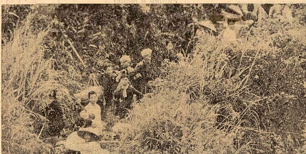
Apariția militarilor americani într-un sat sud-vietnamez aduce întotdeauna după sine areștări, schingiuiri, lacrimi. De aceea, acești țărani sud-vietnamezi dintr-un sat situat nu departe de Bong Son, preferă să la drumul junglei, sperînd să scape astfel de toate aceste grozăvii.