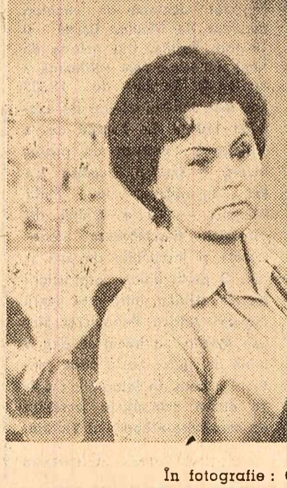
În fotografie: O scenă din film