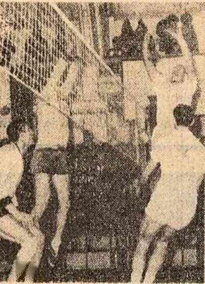
O combinație ofensivă a dinamoviștilor.

se anunța deosebit de dificil pentru sportivii noștri. Cu toate acestea, dinamoviștii au reușit nu numai să se revanșeze, ci și să-i depășească adversarii la scorul categoric de 3-0 (15-9; 15-4; 15-3).