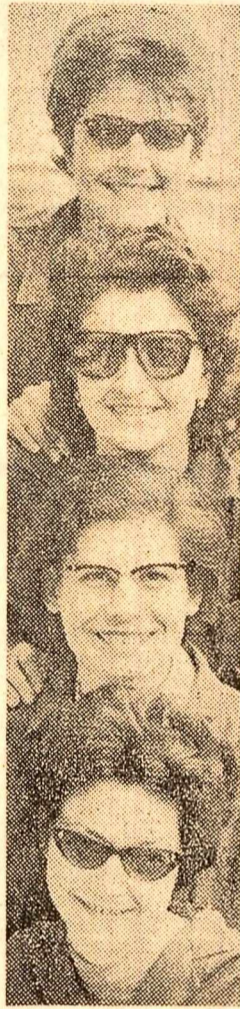
Pentru sezonul de vară fabrica „Secur” din Capitală a pregătit noi modele de ochelari