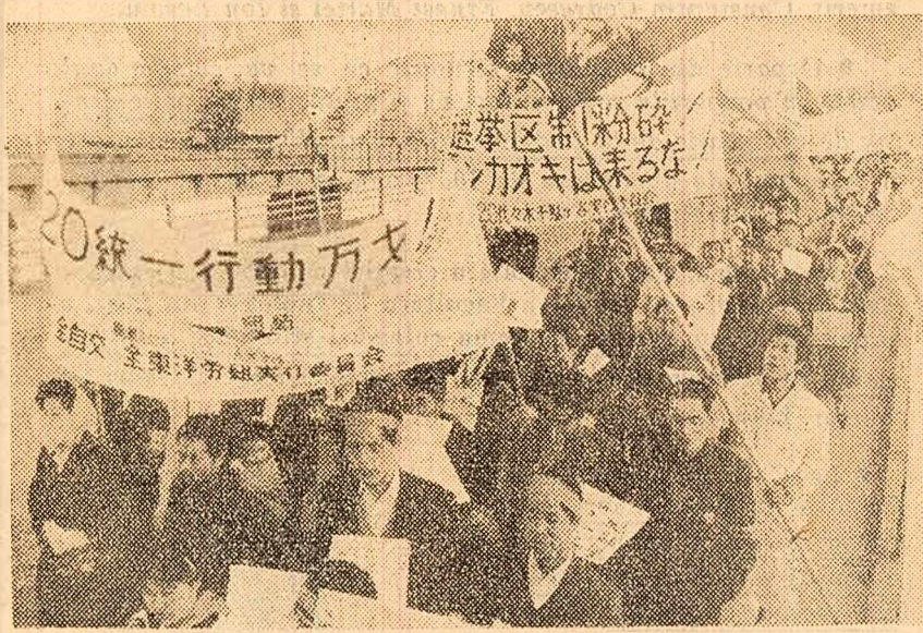
TOKIO. Peste 200 000 de persoane au participat zilele trecute la un miting de protest împotriva scumpirii vieții și a apropiatelor vizite a premierului sud-vietnamez în Japonia

Observatorii politici consideră că obiectul întreprinderilor pe care le are la Atena ministrul de externe cipriot, Kyrianiu, care și-a amintit de mai multe ori plecarea spre patrie, îl constituie diferendul existent între președintele Makarios și generalul Grivas.