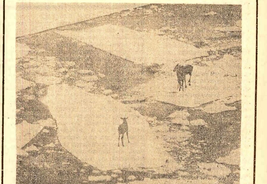
Pentru salvarea acestor cerbi izolați pe mici bucăți de gheață, ce pluteau în derivă în largul Mării Baltice, a fost nevoie de intervalele elicopterului care l-a gonit spre un punct apropiat de coasta suedeză

Puternicele furtuni care s-au abătut în ultimele zile asupra unor regiuni ale Braziliei au provocat moartea a peste 40 de persoane în statele Rio de Janeiro și Guanabara.