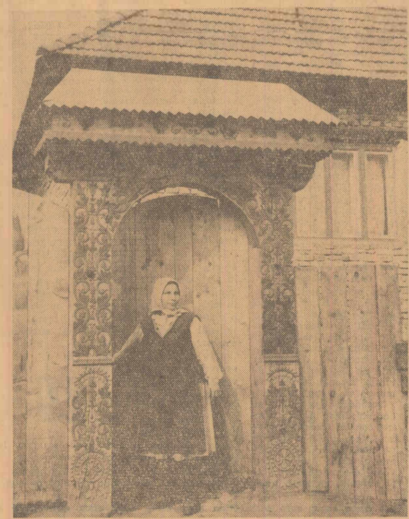
Portă țărănească (comuna Satu Mare din raionul Odorhei)