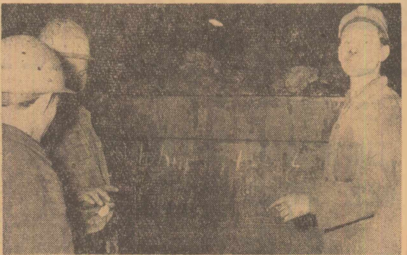
Ca urmare a dificultăților prin care trece industria carboniferă a R.F.G., o serie de mine vor fi închise. În fotografie: Ultima vagonetă cu cărbunul părăsește mina Langenbrunn, care își va înceta activitatea

ciilor privind încheierea unui nou contract colectiv de muncă.