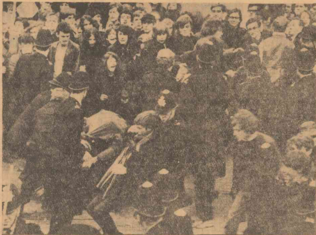
Zilele trecute, la Londra au avut loc demonstrații pentru pace și dezarmare, împotriva războiului din Vietnam. În cursul lor s-au produs ciocniri între manifestanți și poliție