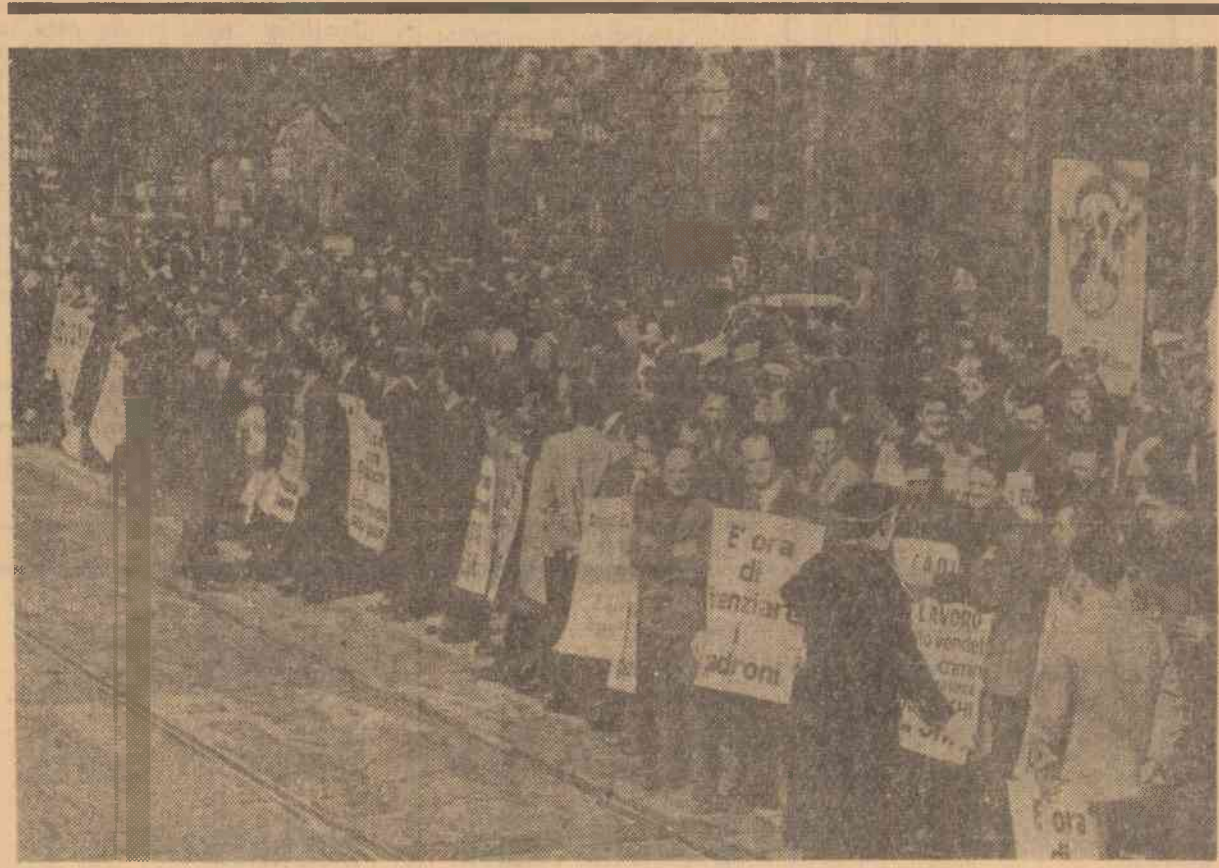
ITALIA. „Este ora de concediere a patronilor” scrie pe un afiș purtat de muncitorii de la „Cobianchi” din Milano în timpul unei manifestații în fața palatului Mont-Edison unde avea loc ședința de funcționare a societățiiilor Edison și Montecatini