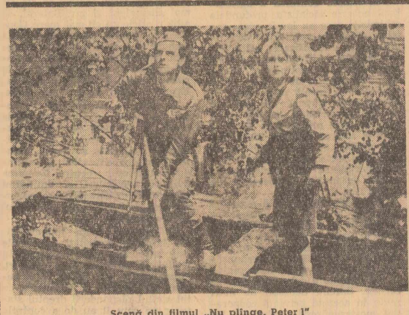
Scenă din filmul „Nu plînge, Peter!”