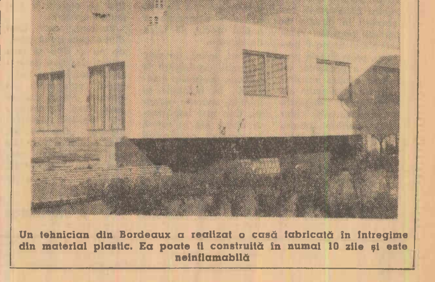
Un tehnician din Bordeaux a realizat o casă fabricată în întregime din material plastic. Ea poate fi construită în numai 10 zile și este nelămpăcită

În localitatea Kangge din nordul R.P.D. Coreene trăiește un copil care, în scurtă sa existență de numai 26 de luni, a reușit să-și câștige o mare faimă datorită dezvoltării lui neobișnuit de prematură. La 2 ani și două luni, micuțul are greutatea de 19 kg și înălțimea de 98 cm. El poate ridica pînă la 12 kg într-o mîna, este sănătos, nu mănîncă la fel ca frații lui mai mari, în vîrstă de 6 ani, și are un caracter liniștit. După spusele mamei sale, la naștere a avut greutatea și statura normale, dar, de cînd a început să fie alăptat, a crescut vîzînd cu ochii.