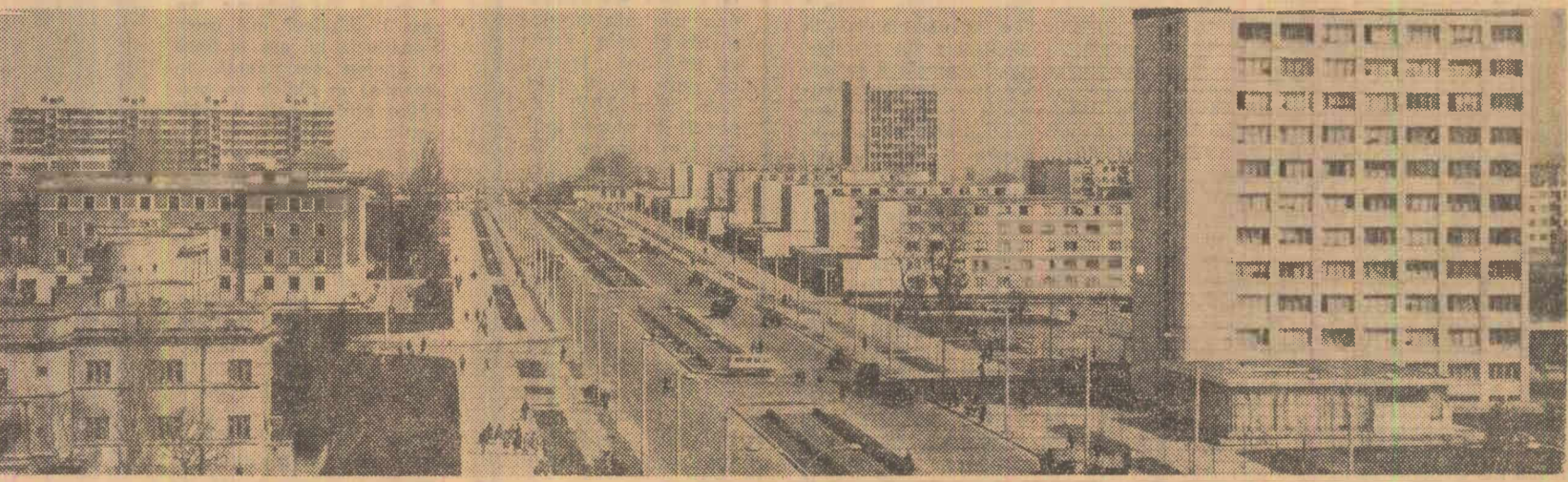
Cartierul Țigăna II din Galați